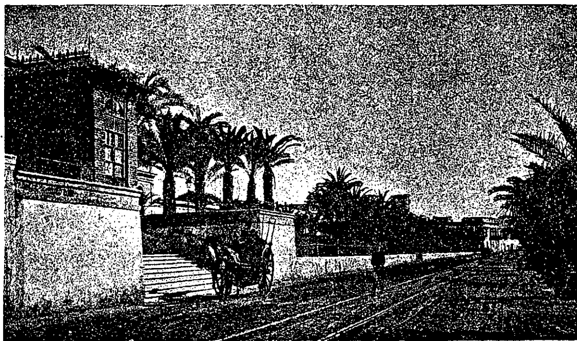
PASEO DEL MALECÓN Y VISTA DE LA VÍA MARÍTIMA

vincia, que antes revestían verdadera importancia.