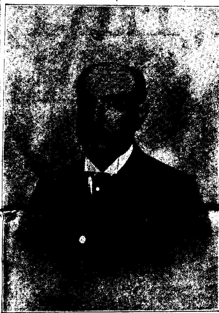
D. MANUEL TEJERO MELENDEZ

Alcalde de Granada y Presidente honorario de «El Botijo», de Almería.