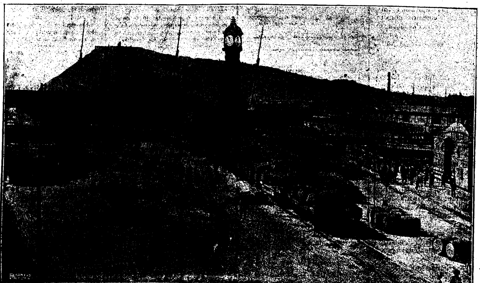
AL TRAVES DE ESPAÑA—BARCELONA VISTA DEL PUERTO