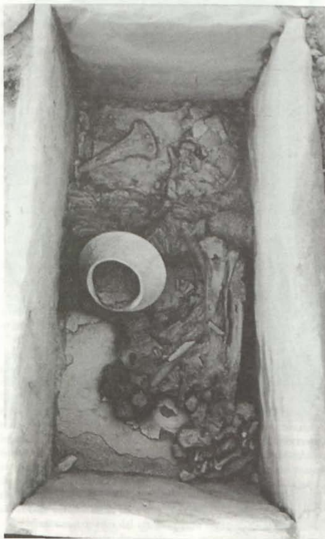
LÁM. V. T41 de Gatas. Zona C.

la bóveda de cubierta. Debajo del otro horno, al Oeste del anterior, se localizó la T41. Se trata de un enterramiento en cista, que contenía el esqueleto de un individuo masculino senil y un ajuar compuesto por una alabarda y un puñal de cobre y por una vasija cerámica de la forma 5 (Lám. V).