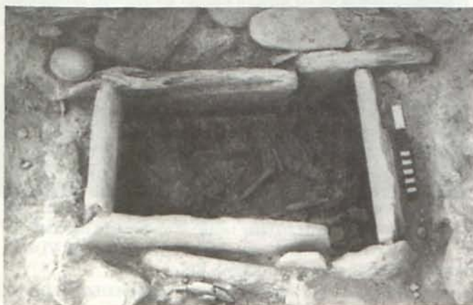
LÁM. IV. T39 de Gatas. Zona C.

El sector Norte de los cuadros centrales de la Zona C ofreció la estratigrafía de la terraza intermedia del área excavada hasta ahora en la Ladera Media II. Cuenta con niveles de ocupación de dos espacios estructurados de la última fase argárica, separados por un tabique. En la parte Este se documentó el enterramiento de una criatura de 3 a 5,5 meses de edad en urna de tipo 2 B3 (T40), con un ajuar compuesto por un brazalete de bronce. Estaba colocada en un hoyo revestido de piedras y con una tapa de cierre que sellaba el conjunto (Lám. III). En un momento anterior, el mismo sector estuvo ocupado por un área de consumo donde destaca la presencia de restos faunísticos y útiles de molienda. A este espacio corresponde una nueva tumba (T39) (Lám. IV), una cista calzada con abundantes útiles de molienda, que contenía los restos de un individuo de 14-16 años, probablemente masculino, cuyo único ajuar consiste en una concha perforada.