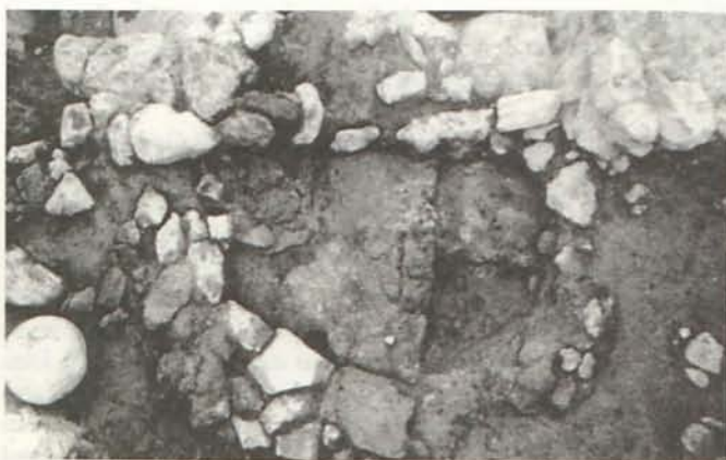
LÁM. II. Estructura de combustión de la fase GATAS IV. Zona C.

Debajo del piso del área de molienda citada, se registró la primera estructuración de la fase IV de Gatas. Se constató una estructura de combustión, que se levantó en el espacio central de una unidad estructural anterior, que tenía planta rectangular de 25/30 m 2 . La citada estructura de combustión presentaba un muro de planta circular y lechos con evidencia de una fuerte termoalteración (Lám. II).