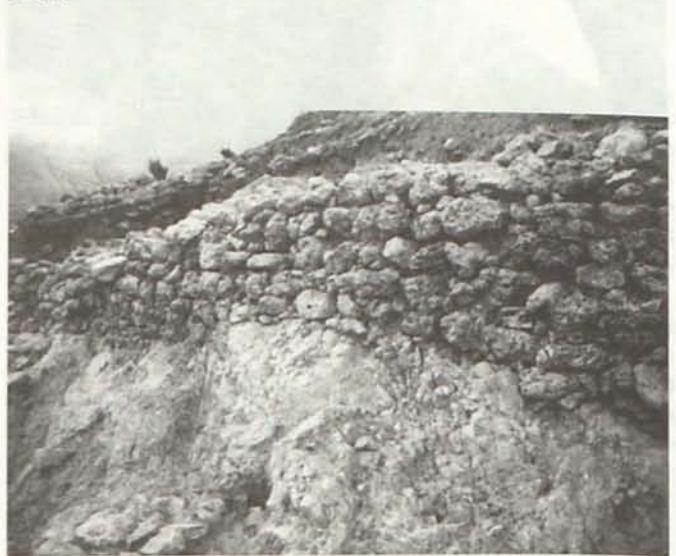
LÁM. VII. Muro cabecero de la unidad arquitectónica de la fase GATAS V. Zona C.

Sur el área excavada. Para ello ha sido necesario ampliar 1 m. la cuadrícula, de manera que dicho muro quedara incluido en el espacio de la excavación. Se trata de un muro cabecero de doble paramento, construido fundamentalmente con travertino (Lám. VII). Delimita un espacio de unos 60 m 2 , cuya orientación va de Sur/Sudoeste a Norte/Nordeste, girando hacia el Norte en su extremo oriental, mientras que por el Oeste sólo se conserva una hilada apoyada en la roca. El cierre distal de esta unidad arquitectónica no se ha conservado debido a la erosión. Sin embargo, en su interior se registraron diversos compartimentos, con muros de piedra y de tapial, correspondientes a varias reestructuraciones del espacio en el marco de la fase GATAS V, el primer asentamiento postargárico del cerro. El cambio en la organización del espacio de la Ladera Media II de Gatas que representa esta unidad coincide con el declive de las prácticas funerarias argáricas y con otras transformaciones vinculadas al final del grupo argárico c. 1500 cal ANE.