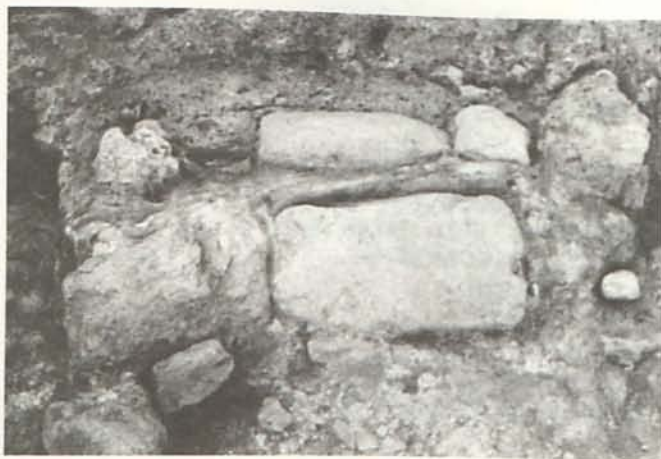
LÁM. I. Área de molienda de la fase GATAS IV. Zona C.

En la parte Sudoeste se ha excavado un área de molienda del último asentamiento argárico, ubicada en una estancia delimitada por banquetas construidas con zócalos de piedra con revoque de arcilla amarilla, en las que se apoyaban los útiles líticos destinados al procesado de alimentos vegetales (Lám. I). Esta estancia estaba separada de un espacio de almacenaje por un muro, junto al cual se ha registrado una tumba en urna (T43). Esta tumba apareció alterada, ya que en su interior se encontró un relleno de piedras y