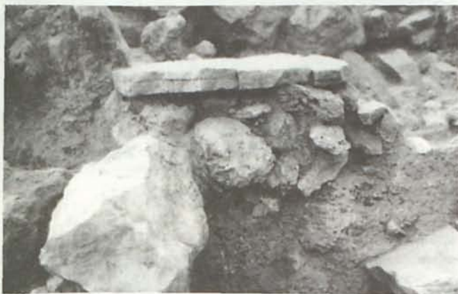
LÁM. III. T40 de Gatas. Zona C.

En la base del relleno citado pudo reconocerse un nivel sedimentario que ocupaba el espacio delimitado por un entalle de roca recortada para acondicionar un área útil y que se apoyaba igualmente en una superficie nivelada de roca natural. A la espera de las dataciones radiométricas, los restos artefactuales de este nivel permiten sugerir que corresponde a la ocupación preargárica (GATAS I).