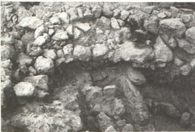
LÁM. IX. Plataforma absidal de la fase GATAS III. Zona C.

El final del asentamiento argárico (GATAS IV) está representado en el sector Este de la Zona C por dos unidades habitacionales con muros cabeceros y medianero de piedra y con superestructuras de láguenas (Lám. VIII). La unidad occidental fue destruida en la reestructuración arquitectónica postargárica, mientras que la unidad oriental se extiende al Este de la zona excavada. A una fase anterior, probablemente GATAS III, corresponde una nueva unidad arquitectónica delimitada por muros de piedra, que presenta un ábside en su parte septentrional. En este ábside se ha registrado una plataforma que configuró una superficie semicircular, una solución arquitectónica desconocida hasta ahora en Gatas (Lám. IX). Debajo de los niveles vinculados a esta habitación se registraron rellenos y restos de estructuras de las primeras fases argáricas sobre la roca, donde aparecieron decoraciones cerámicas de estilo campaniforme.