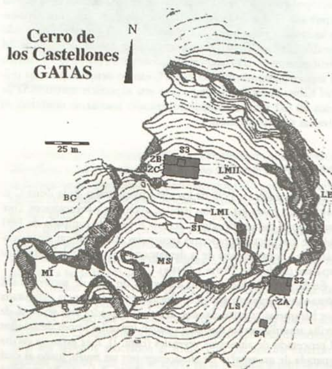
FIG. 1. Situación de las zonas objeto de las excavaciones sistemáticas en la Ladera Media II del cerro de Gatas. (Zonas B y C).

La fase III se inició durante la campaña de excavaciones de 1987 en la denominada Zona A, ubicada en la Ladera Sur del yacimiento. En este sector se localizaron una serie de depósitos argáricos y postargáricos y una estructura de planta curva (9). En la campaña de 1989 (10), el sector elegido para la realización de las excavaciones extensivas fue la Ladera Norte del yacimiento (Ladera Media II), donde se planteó la excavación en extensión de la Zona B. Para ello se tomaron como referencia las secciones del Sondeo 3, en el que se habían registrado varias estructuras habitacionales del segundo milenio antes de nuestra era y de época andalusí. Finalmente, en la campaña de 1991 (11), se procedió a abrir en extensión una nueva zona (Zona C), en el área situada inmediatamente al Sur de la Zona B (Fig. 1).