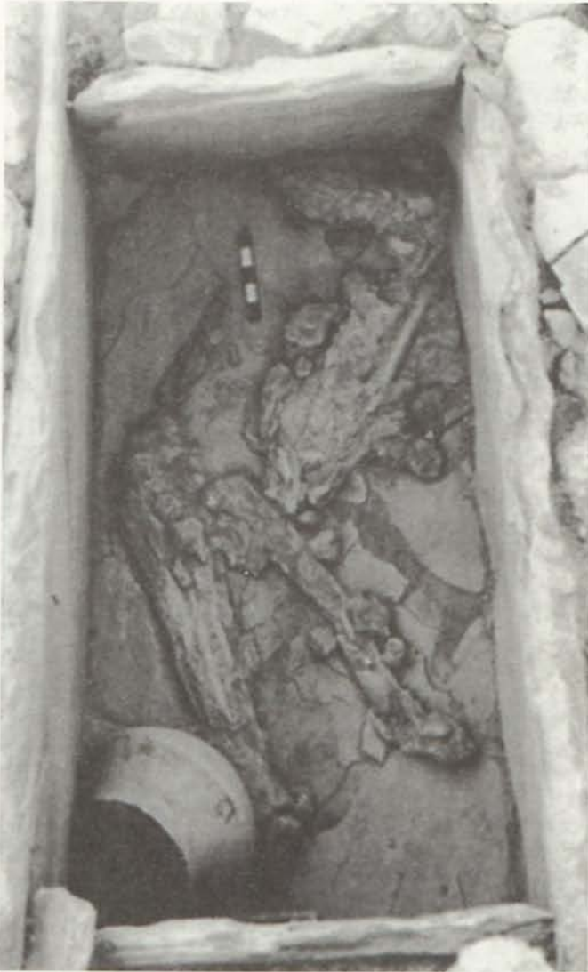
LÁM. VI. T42 de Gatas. Zona C.

de GATAS II en su parte occidental. Esta cabaña presentaba una planta curva, cuyos muros presentan un zócalo de piedra al que se adosaba un hogar.