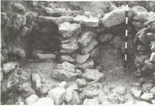
LÁM. VIII. Estructuras murarias de las estancias sudorientales de la fase GATAS IV. Zona C.

El final del asentamiento argárico (GATAS IV) está representado en el sector Este de la Zona C por dos unidades habitacionales con muros cabeceros y medianero de piedra y con superestructuras de láguenas (Lám. VIII). La unidad occidental fue destruida en la reestructuración arquitectónica postargárica, mientras que la unidad oriental se extiende al Este de la zona excavada. A una fase anterior, probablemente GATAS III, corresponde una nueva unidad arquitectónica delimitada por muros de piedra, que presenta un ábside en su parte septentrional. En este ábside se ha registrado una plataforma que configuró una superficie semicircular, una solución arquitectónica desconocida hasta ahora en Gatas (Lám. IX). Debajo de los niveles vinculados a esta habitación se registraron rellenos y restos de estructuras de las primeras fases argáricas sobre la roca, donde aparecieron decoraciones cerámicas de estilo campaniforme.