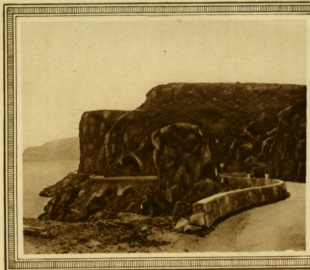
Carretera a Aguadulce.

Carta-sobre.—Serie 6. a —Almería.—B (79).