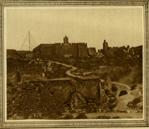
Torreones y Torre de la Vela en la Alcazaba.