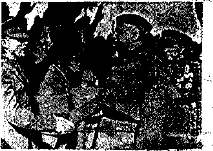
El Caudillo, después de recibir las fuerzas que le rindieron homenaje en Almería, saluda cordialmente a los señores jefes y oficiales de nuestra gubernación.

El discurso del Generalísimo, que se celebró en Almería, ha hallado un resonante eco en Berlín y Londres. El discurso del Generalísimo, que se celebró en Almería, ha hallado un resonante eco en Berlín y Londres.