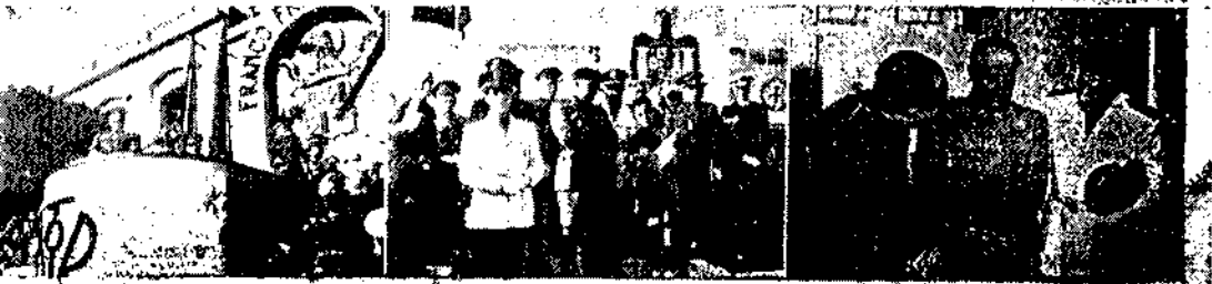
El Caudillo, precedido de los señores de la Gubernación, el Generalísimo, acompañado del Gobernador civil y Jefe provincial del Movimiento y Jefe de la Gubernación, recibió a las explicaciones de la Gubernación de Almería.