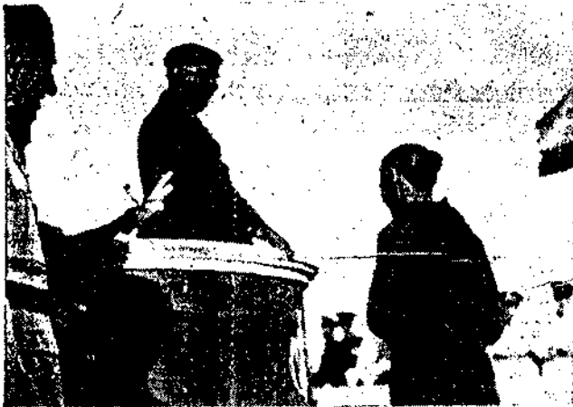
El Caudillo y Jefe Nacional de la Falange, al hacer entrega de un nuevo grupo de viviendas a familias humildes, hace rico

El Jefe nacional entregó un donativo de 5.000 pesetas para los pobres de la ciudad