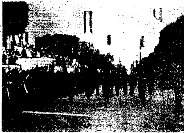
Ante el Cuartel, reemplazado del Ministerio Secretaría general del Partido, desfilan los dirigentes almerienses, alistas al corte por las siglas de las F. y J. N., en la gran plaza.

ALMERIA. En un momento de la historia de España, Almería, por su posición estratégica, ha sido el punto de partida de una gran obra de regeneración. Desde el momento en que se fundó, ha sido un punto de partida de una gran obra de regeneración. Desde el momento en que se fundó, ha sido un punto de partida de una gran obra de regeneración.