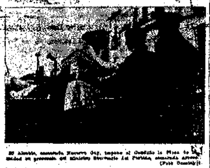
El Almirante, condecorado... ciudad en presencia del Ministerio...

Los proyectos presentados a las Cortes Españolas presentada enmiendas a otros proyectos (Continuación en la pág. 2)