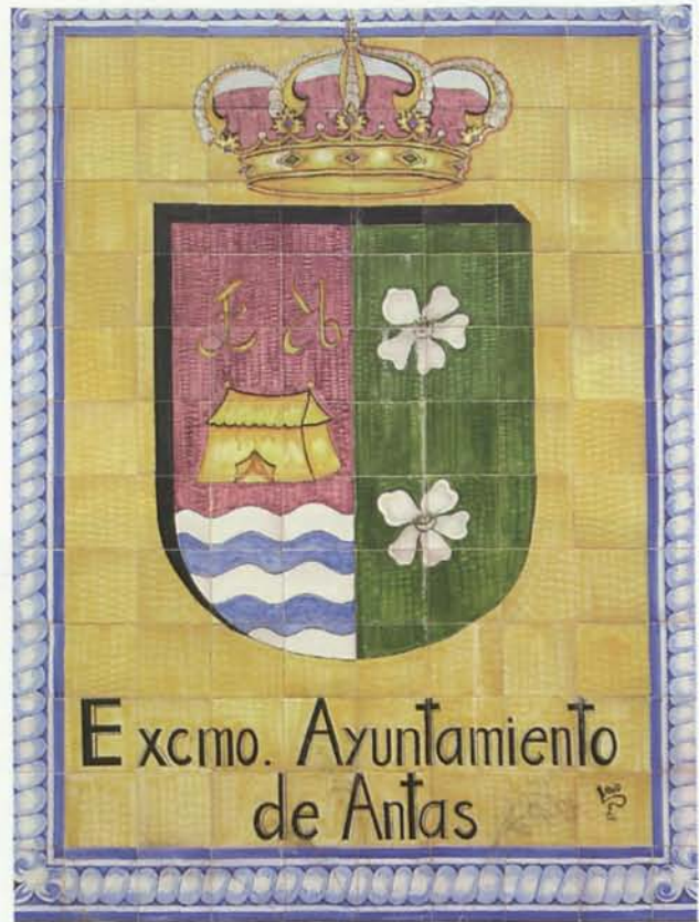
8. Armas municipales concedidas (en El Real de Antas)

“No obstante lo expuesto el Ayuntamiento no quiere ampararse en meros defectos formales, sino que se pretende que el expediente se resuelva de la mejor forma posible, es por ello que se envía