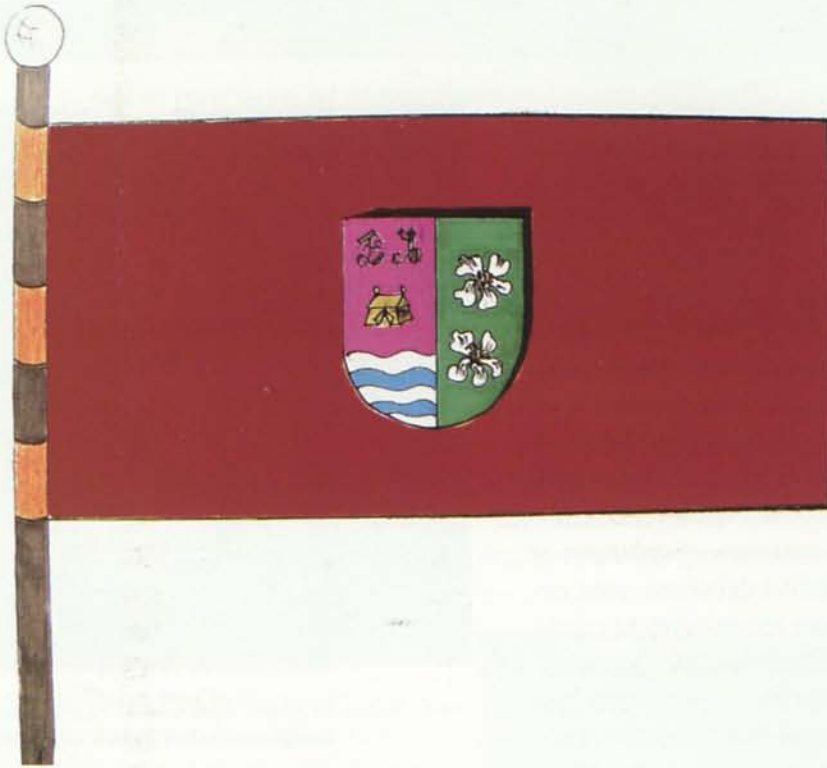
10. Bandera municipal de Antas

Así termina esta dura y penosa andadura hacia la consecución de este blasón heráldico y bandera municipal tras más de cinco años de lucha con la Administración, a los que ha habido que sumar otros seis para registrarlo.