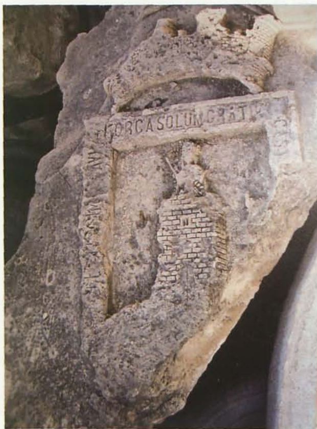
1. Armas municipales de Lorca

También las ciudades y municipios desean timbrar sus armas con ellas y piden la concesión de estas a sus reyes. El abuso en el uso de las coronas fue tan grande que Felipe II tuvo que intervenir y el 8 de octubre de 1576 regla el empleo de las coronas haciendo constar: “[...] para poner orden en el exceso que ha habido y hay en poner coronas en los escudos de armas, en los sellos y reposteros, que