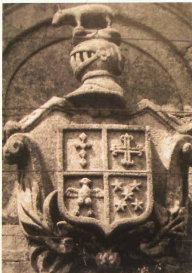
4. Armas de enlace familiar del linaje Antas

Pero volviendo al término municipal de Antas que es lo que nos interesa, mi corta investigación, pues considero que debe haber alguna mucho mas exhaustiva llevada a cabo por algún hijo de Antas que rebusque en el Archivo Histórico de Vera y en el propio de Antas para sacar a la luz su historia, y así poder conocer la mayoría de datos y fechas que han jalonado las vicisitudes tanto de sus habitantes como del espacio geográfico que ocupa, como por ejemplo la fecha de su emancipación de Vera y las distintas peripecias hasta que éste se produjo.