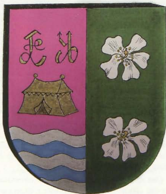
9. Escudo heráldico municipal de Antas

Ayuntamiento dicho acuerdo a lo largo de un plazo de 20 días.