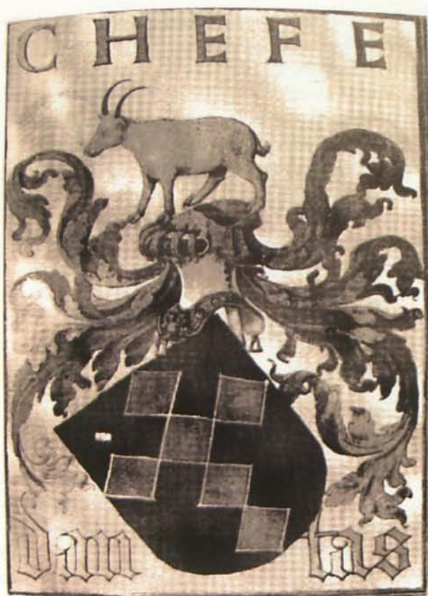
3. Armas del linaje Antas