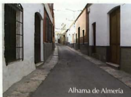
Alhama de Almería

Los planes urbanísticos municipales han de ser mucho más que simples documentos que definen alineaciones y alturas, o que posibilitan que se pueda construir en determinados espacios.