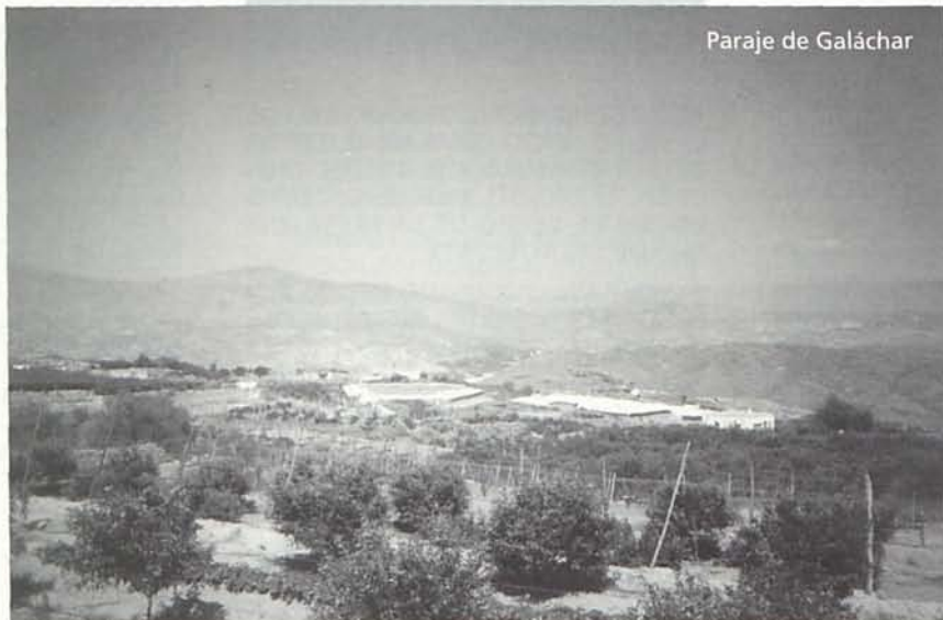
Paraje de Galáchar

CASTILLO, EL CERRO DEL MILANO, EL COCÓN DE LA MALAGUILLA, EL CONJURO, EL CONTRATA, LA CORTIJO, EL CORTIJO DE PANDURO, EL CUESTA DE ALHAMA, LA CUEVA DE LA PAJA, LA CHAPARRAL, EL FUENTE, LA