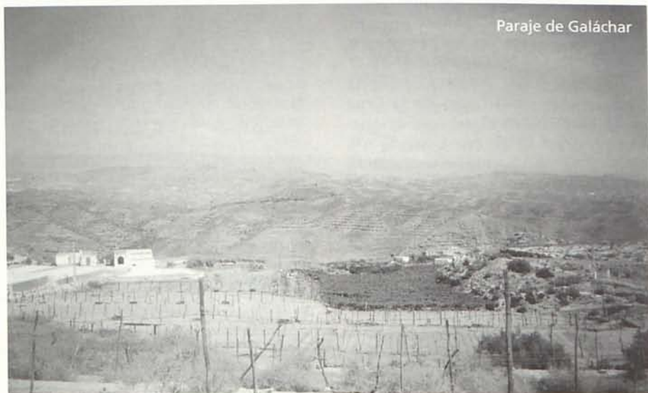
Paraje de Galáchar

La ciudad de Pechina mandó bajo el mandato de Abd-al-Rahman III la fundación de nuevas poblaciones en el Valle del Andarax y otros lugares.