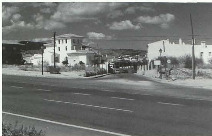
Cruce de la calle Molino con la C.N. - 340

Dicen los "sabiñondillos" de turno que si todo el mundo respetara las señales el cruce no tendría peligro alguno. Y claro. Y si todo el mundo respetara las leyes ni siquiera hacía falta policías. Pero la realidad es la que es y el peligro del cruce es el que es. Es necesario hacer algo. Coincidimos con quienes opinan que la mejor solución no es una rotonda. Pero