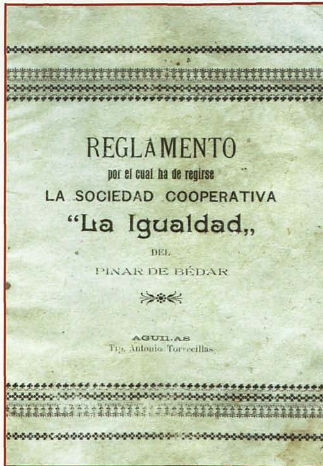
Portada del Reglamento de la Sociedad Cooperativa La Igualdad, fundada en El Pinar de Bédar para estimular al ahorro de las clases trabajadoras.

Artículo 5º. El ingreso en esta sociedad se solicitará del Presidente por medio de una hoja que se facilitará en