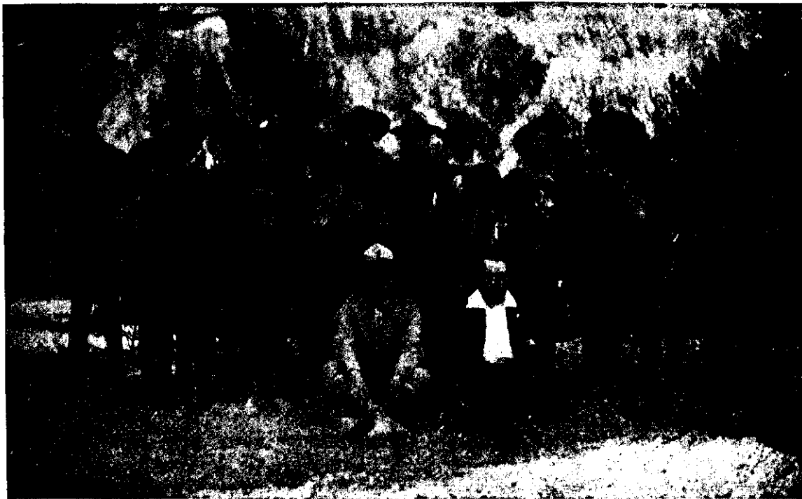
Representación de los Exploradores y lobatos de esta Tropa que al Campamento de este año en Sierra Espuña han asistido con su Presidente del Consejo y Jefe de Tropa.

El 13 de Septiembre una representación de esta Tropa, asistió en Madrid al homenaje que las Uniones Patrióticas, rendían al Sr. Marqués de Estella, uno de los primeros iniciadores y sostenedores de los Exploradores en España,