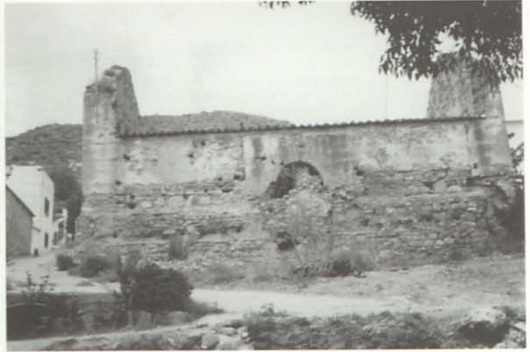
Serena. Mezquita- Iglesia de los moriscos.