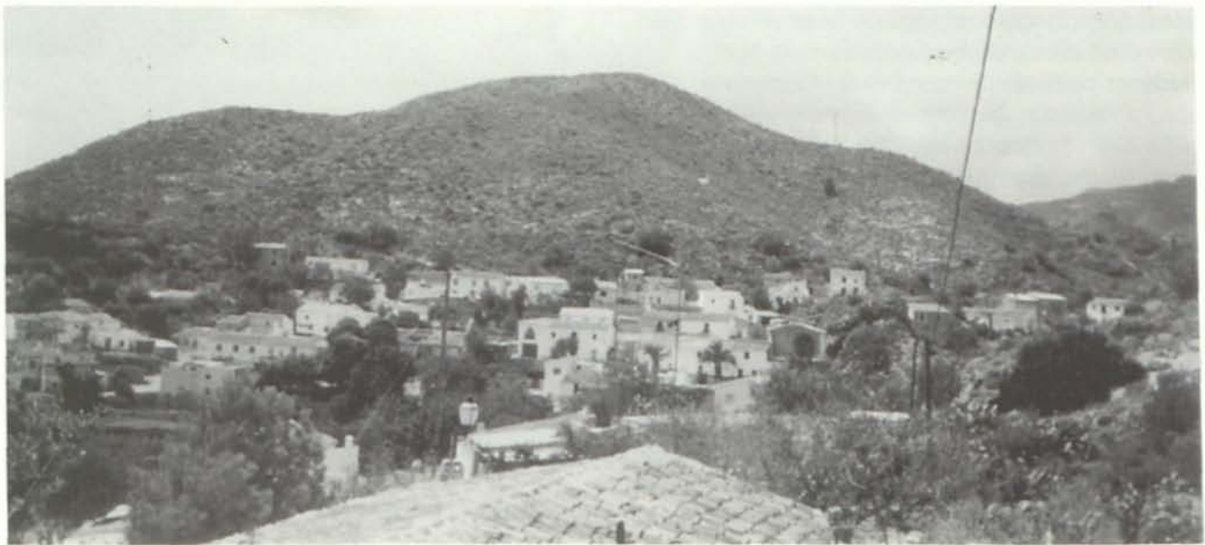
Serena. Vista General.

Vera no tenía pastos propios pero su ganado podía pastar en los de Vera.