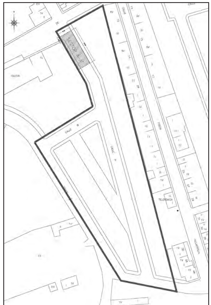
Figura 1. Delimitación.

(art. 6.6.3 NN.SS. de Pechina), se efectuó la presente intervención, con el objetivo de valorar su potencial arqueológico, de cara a adoptar las oportunas medidas correctoras en materia de protección del Patrimonio Histórico. Medidas, unas inmediatas, desarrolladas durante la propia ejecución del Proyecto de urbanización, y otras, mediatas a tener en cuenta en el desarrollo futuro de los terrenos, donde se tiene previsto la construcción para uso residencial de las parcelas reservadas, para este fin.