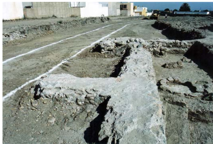
Figura 3. Sector A-A'. Vista desde el Norte.

Asociado a este importante nivel de tierra de labor son los restos documentados en la mitad Norte y Oeste de la Unidad de actuación, que se asocian a una vivienda tipo Cortijo, relacionada con esa explotación agraria y cuya fecha de construcción se remonta a principios del Siglo XIX. Así como todo un sistema de acequias destinadas al riego (UEC 1), con un uso que se ha prolongado hasta nuestros días.