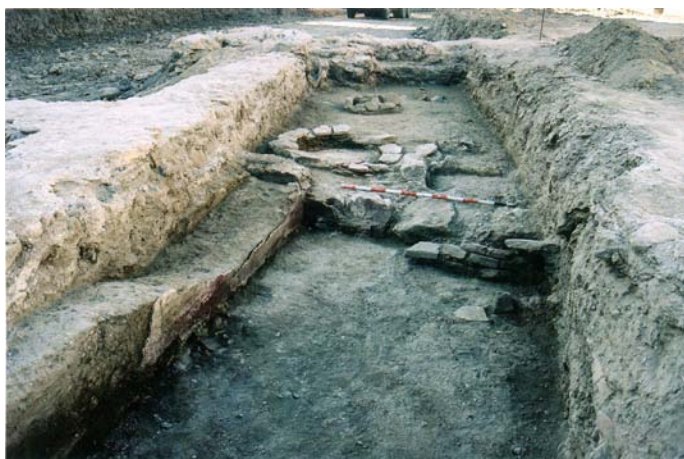
Figura 4. Sector A-A'. Fases Estructurales.

Por lo tanto, el área objeto del presente análisis arqueológico se localiza como parte de la ciudad hispano musulmana de Pechina, cuyo desarrollo en el tiempo va desde finales del Siglo IX hasta mediados del XI, y de ahí su interés de cara a la investigación futura.