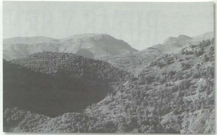
Panorámica General. Sierra "Verde" Alhama.

Bueno, pues vamos a coger el camino del cerro que nos conduce hasta la Ermita nueva, la de abajo. El recorrido es atractivo, sobre todo cuando vas dejando el pueblo a tus pies, se percibe sierra, monte, olor, naturaleza. Hay que señalar que prácticamente se puede subir solo a pie, los desniveles y la imposibilidad de dar la vuelta impiden la subida de vehículos, quizás con un