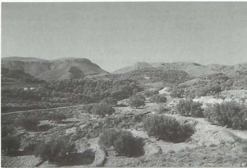
Fincas y Sierra a la espalda de lo que siempre vemos.