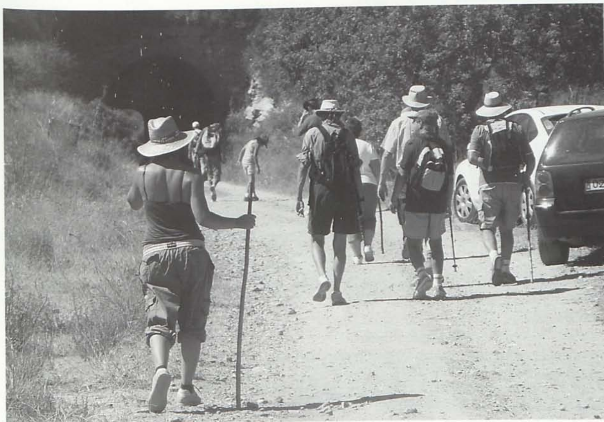
Los excursionistas dirigiéndose hacia el Túnel de Serena o del Servalico, por donde pasaba el tren minero de Serena a Garrucha hasta los años treinta del siglo XX, todavía utilizable, y que ha tenido un pequeño derrumbe interno que habría que restaurar antes de que se produzca un hundimiento mayor.