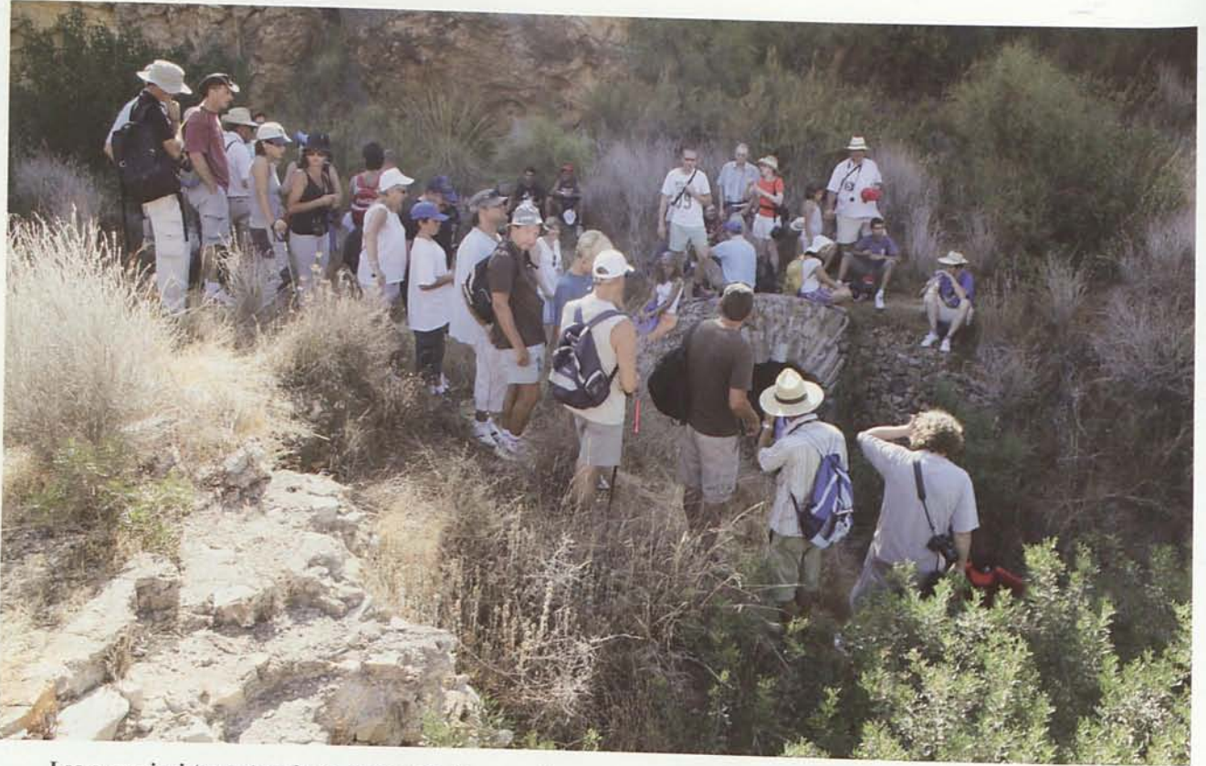
Los excursionistas entrando en grupos de cinco en cinco a una de las trancadas de la Mina Unión de Tres Amigos, que sorprendió a todos por su excelente estado de conservación.