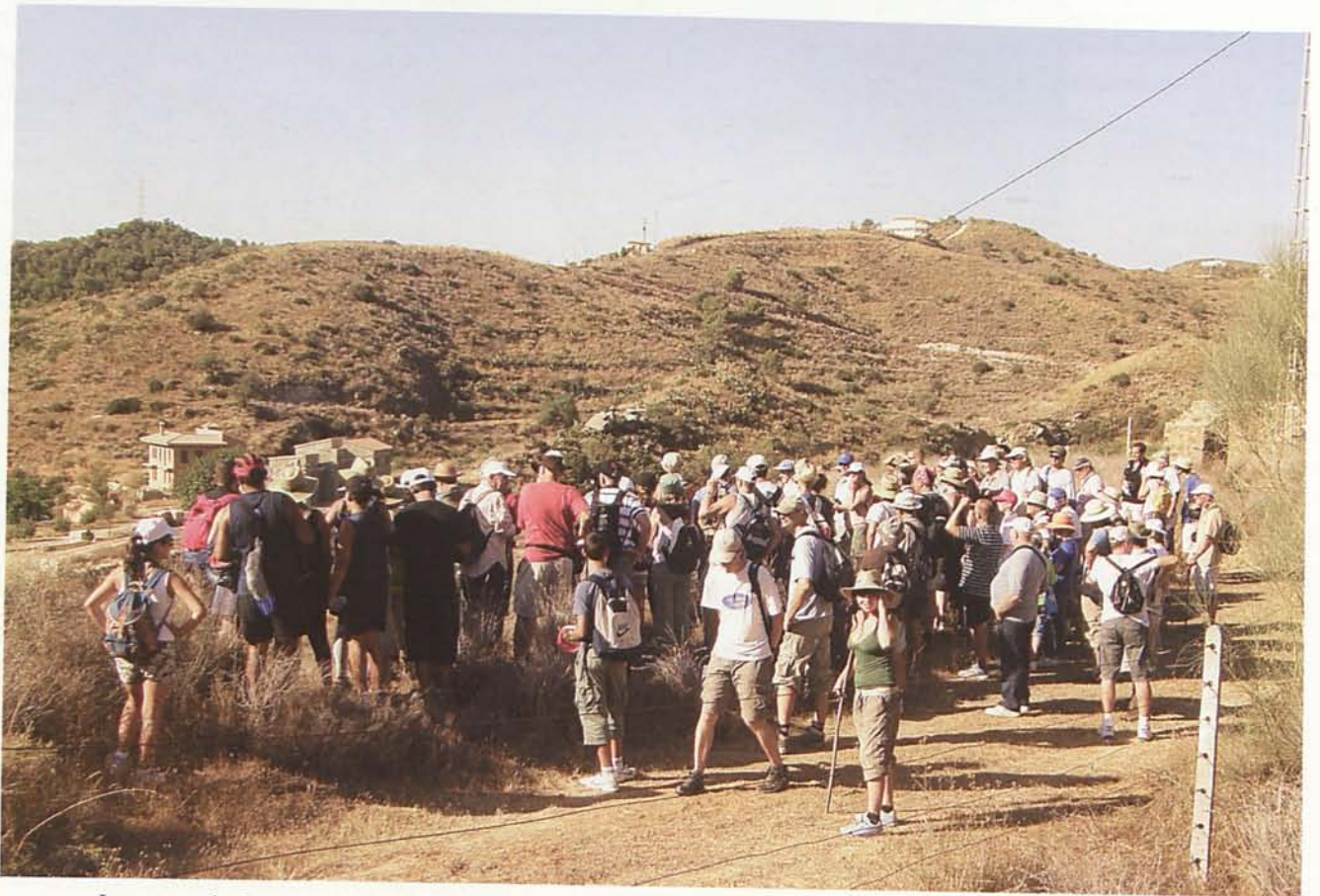
Los excursionistas escuchando las explicaciones de los guías, al tiempo que contemplan las instalaciones de la Mina Pobreza.