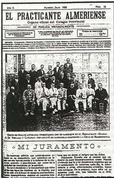
Portada del número 15 de la publicación correspondiente a julio de 1920

Complejo Hospitalario Torrecárdenas. Paraje Torrecárdenas S/ N o - O4009- ALMERÍA