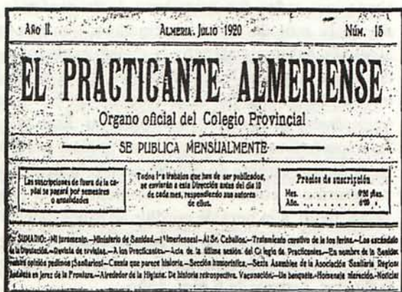
Cabecera de la publicación

Era costumbre la realización de actos sociales y culturales entre los profesionales de la época,