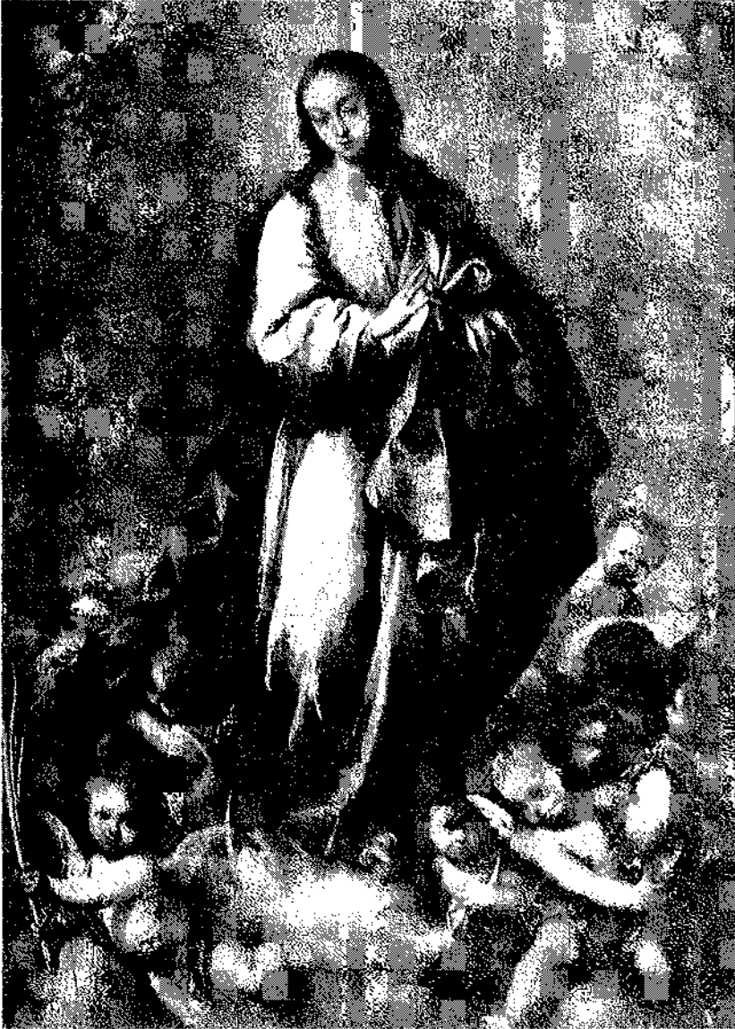
Después del retoque.