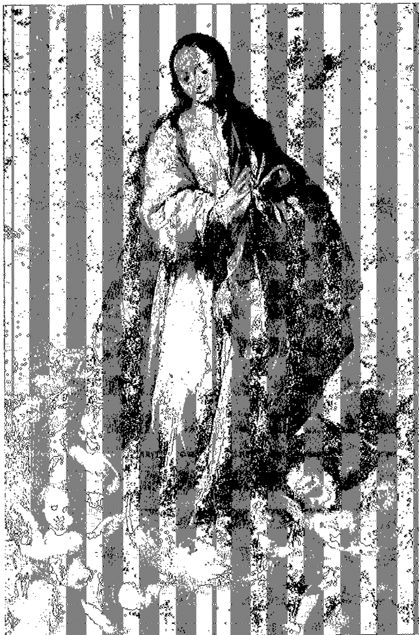
Antes del retoque.