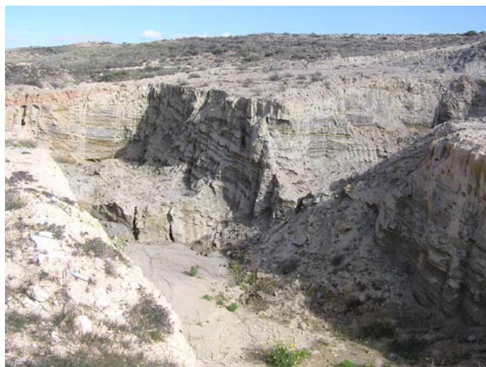
Lámina VI. Vista del sector oriental del área de estudio