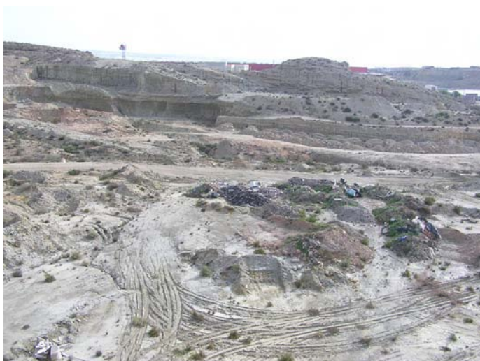
Lámina III. Las actuaciones arqueológicas y expoliaciones marcan el terreno.