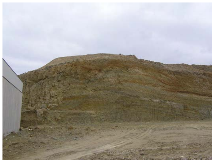
Lámina II. Vista parcial del área a prospectar