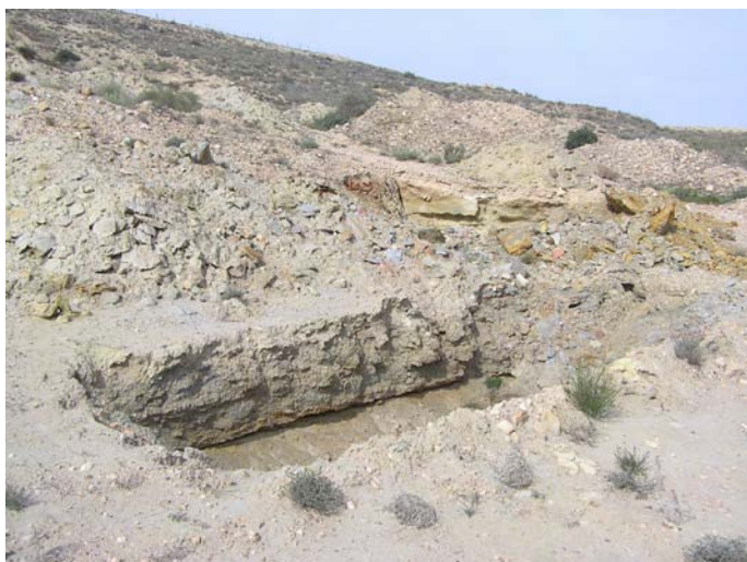
Lámina IX. Cortado donde se sustenta el túmulo.