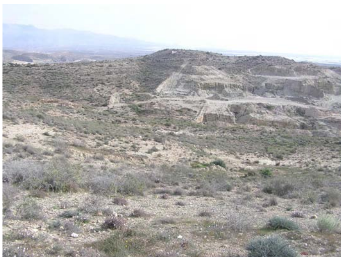
Lámina I. Panorámica del ámbito de estudio