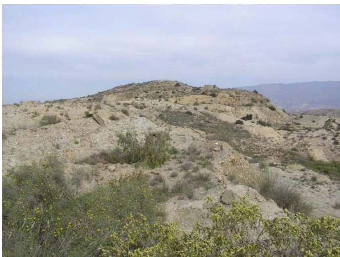
Lámina VII. Remociones en el sector sureste del área de estudio