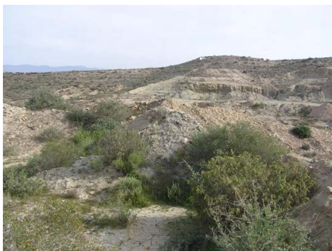
Lámina IV. Vista del presunto túmulo