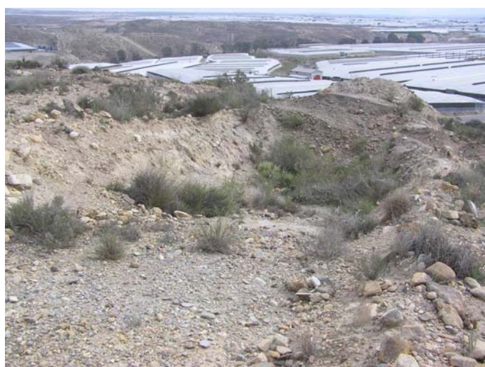
Lámina VIII. Remociones de terreno en el emplazamiento del supuesto túmulo