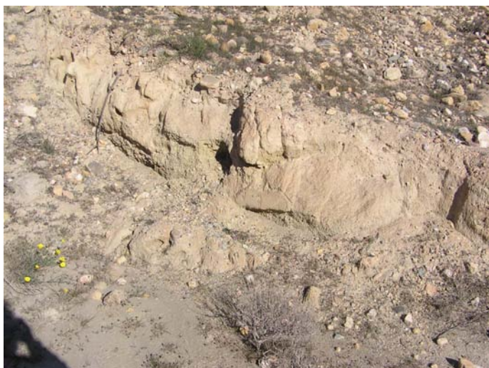
Lámina V. Detalle del revoco de la supuesta estructura