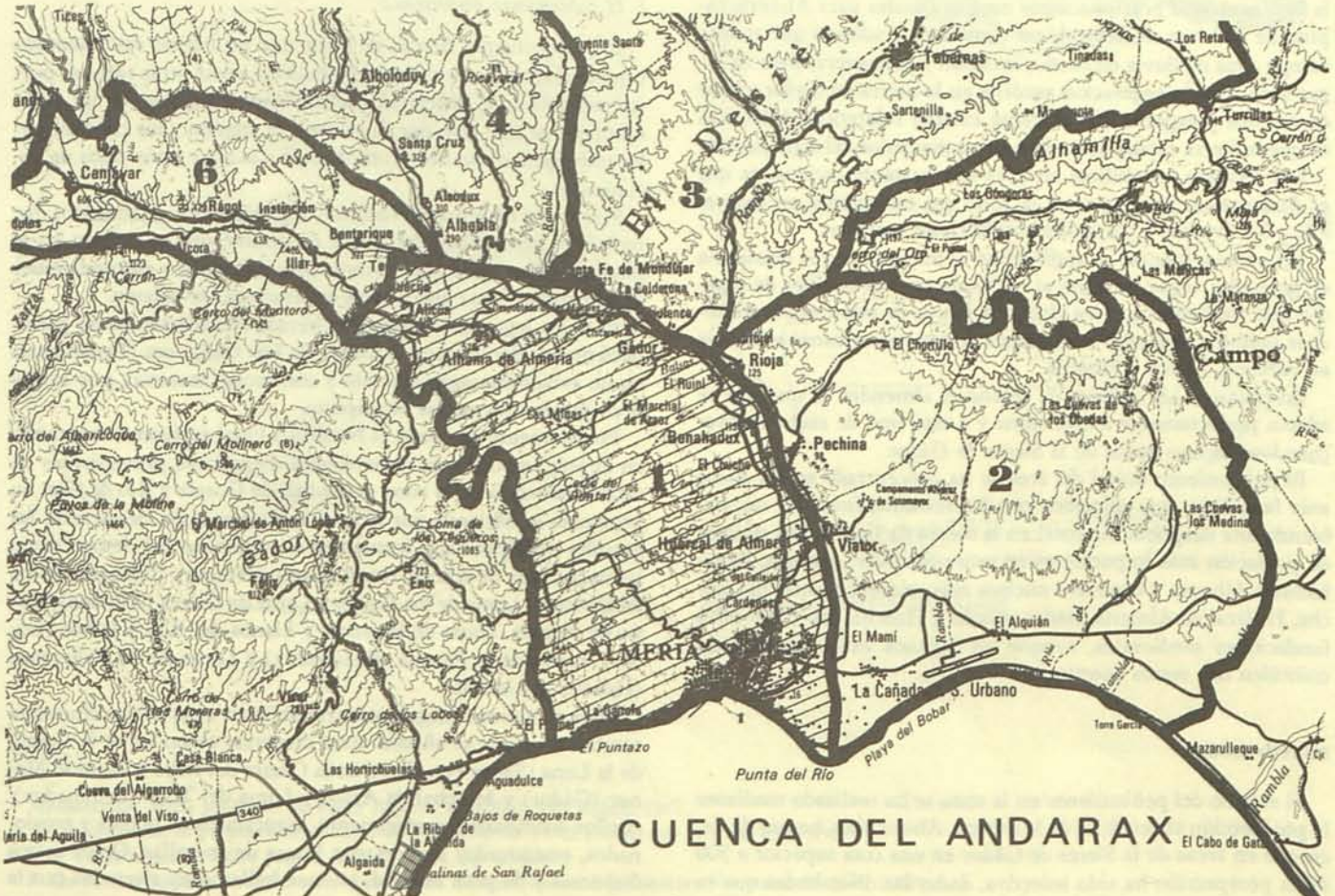
FIG. 1. Cuenca del Andarax.

El poblamiento en esta época está basado en pequeños asentamientos rurales y villas. Entre éstos están el Cerro de Nicolás Go-