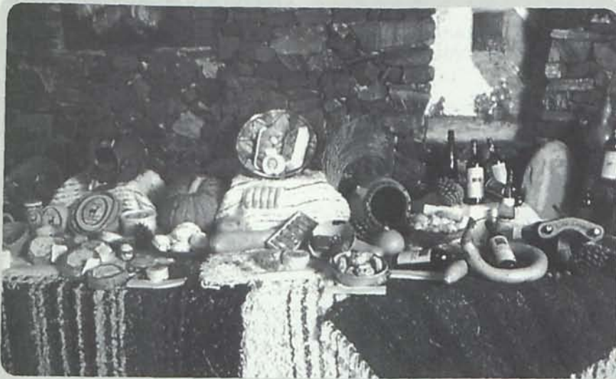
La valorización de los productos locales, como la gastronomía, una de las estrategias del programa Leader.