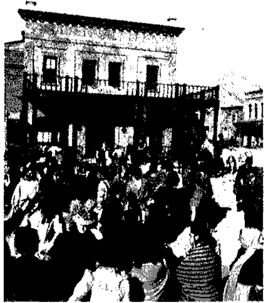
Un poblado del Oeste, hoy Mini-Hollywood.