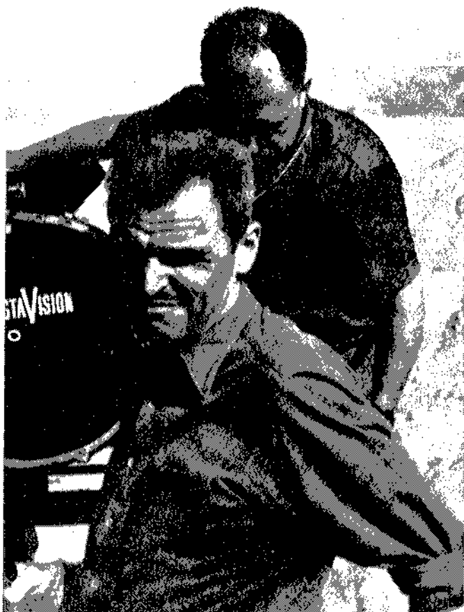
La película «Ojo por ojo» del polémico director francés André Cayatte, no tuvo el éxito que todos esperaban. Nuestro «desierto de Tabernas» continuó inédito unos años más.