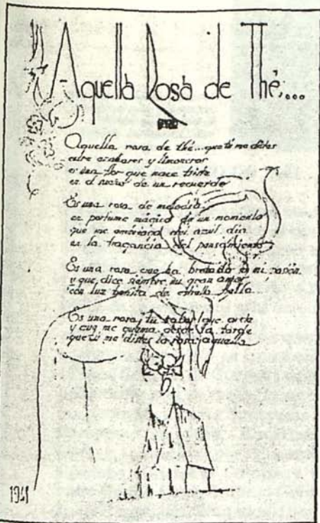
Una muestra de composición poética, escrita por uno de los encuadados en "el parte inglés", durante su estancia en la cárcel.