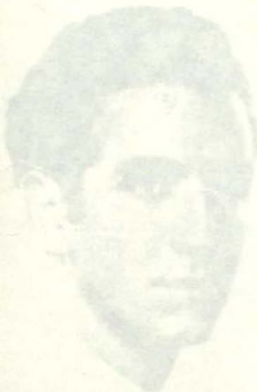
Nombre Cognom Nacimiento Fallecimiento