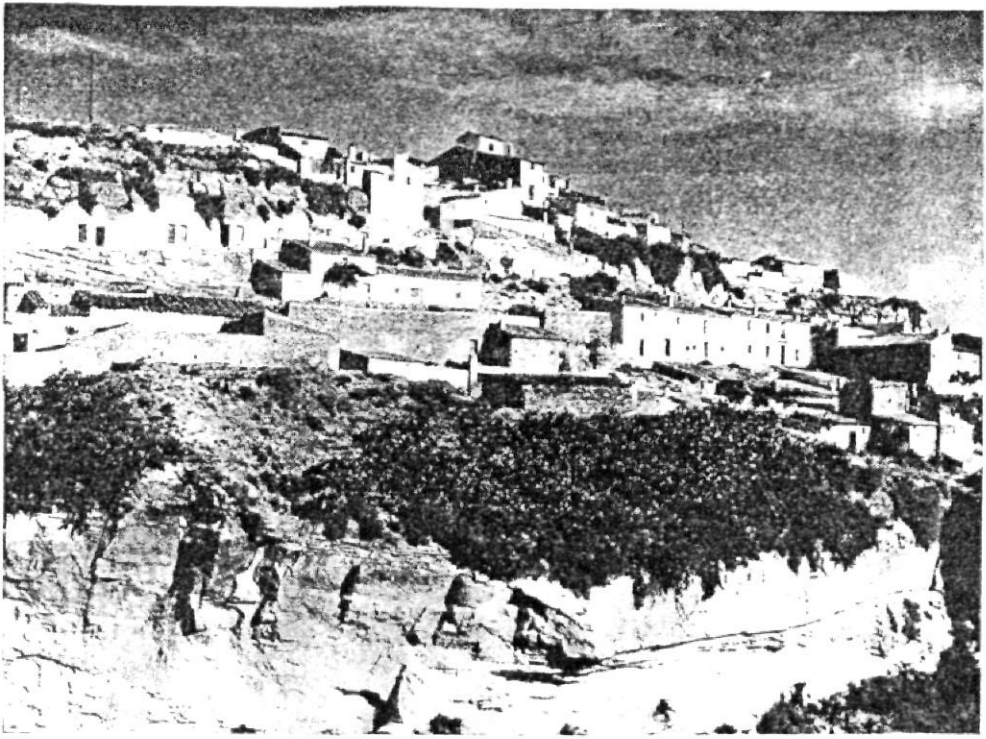
Los pueblos de Almería ofrecen perspectivas únicas, como lo evidencia esta panorámica de Sorbas, en la que se escalonan las edificaciones que vencen el obstáculo de las laderas.