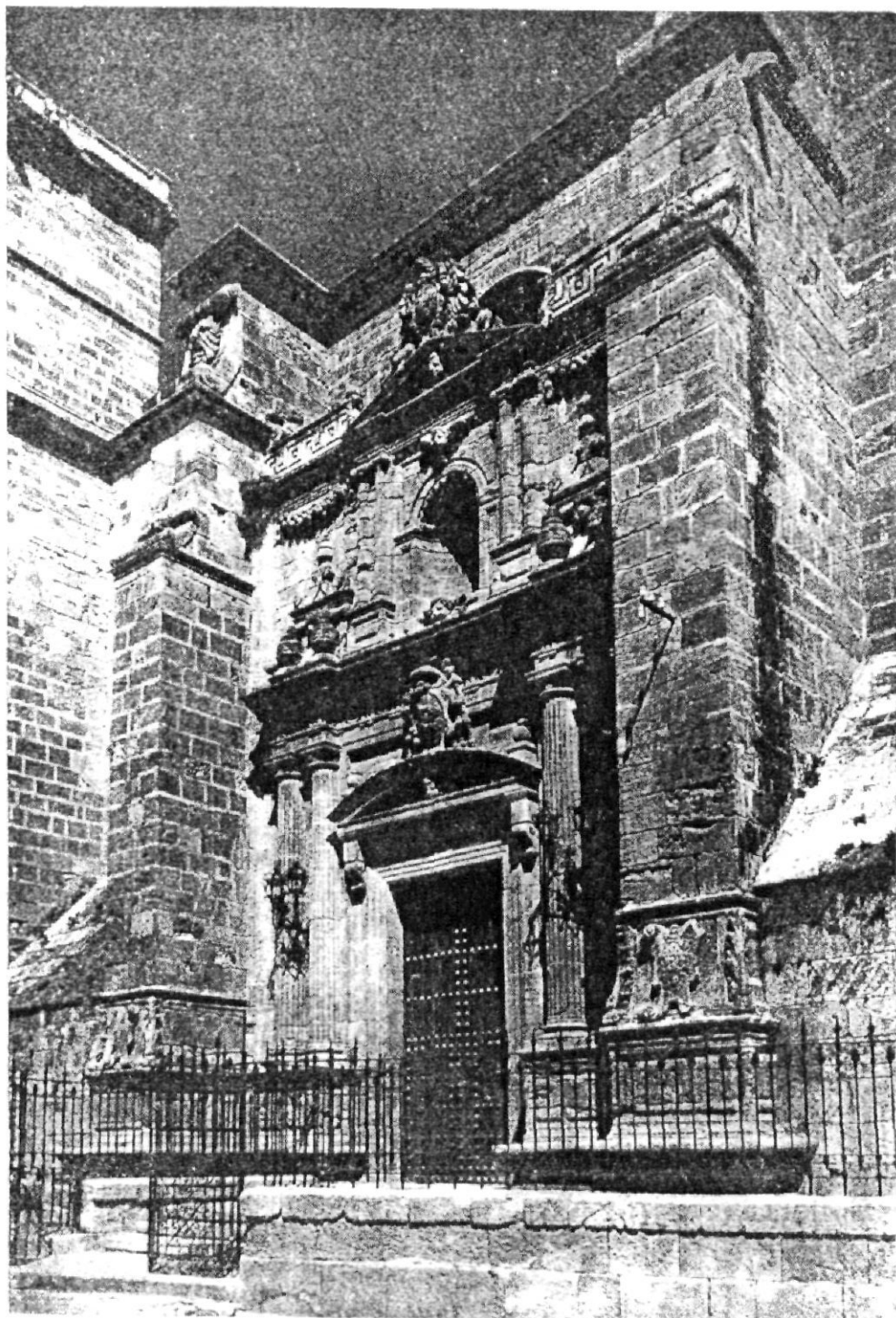
La Almería monumental tiene como exponente máximo en arte cristiano el templo catedralicio, al que pertenece esta espléndida portada