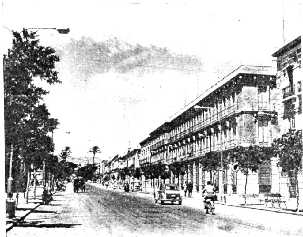
Almería, en su moderna distribución, presenta su gran Avenida del Generalísimo, promesa de una futura población capaz de responder a las exigencias de la época.