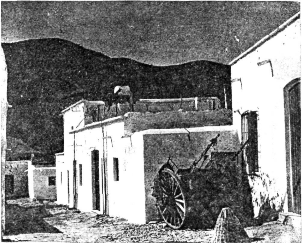
Pueblos en donde la cal, el elemento básico para el ornato de las humildes edificaciones, aprisiona a la luz para recreo del visitante.