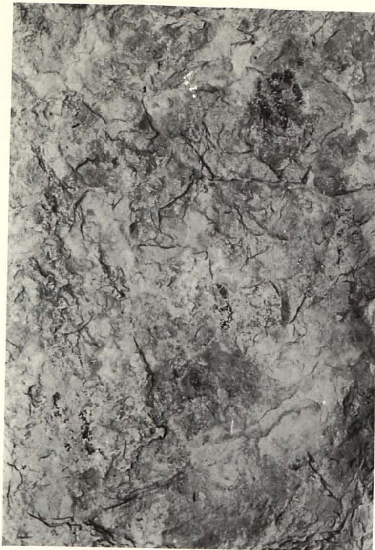
Fig. 4.- Panel izquierdo.

tintas planas y su gama cromática es rojo-castaño. Su estado de conservación es muy deficiente.