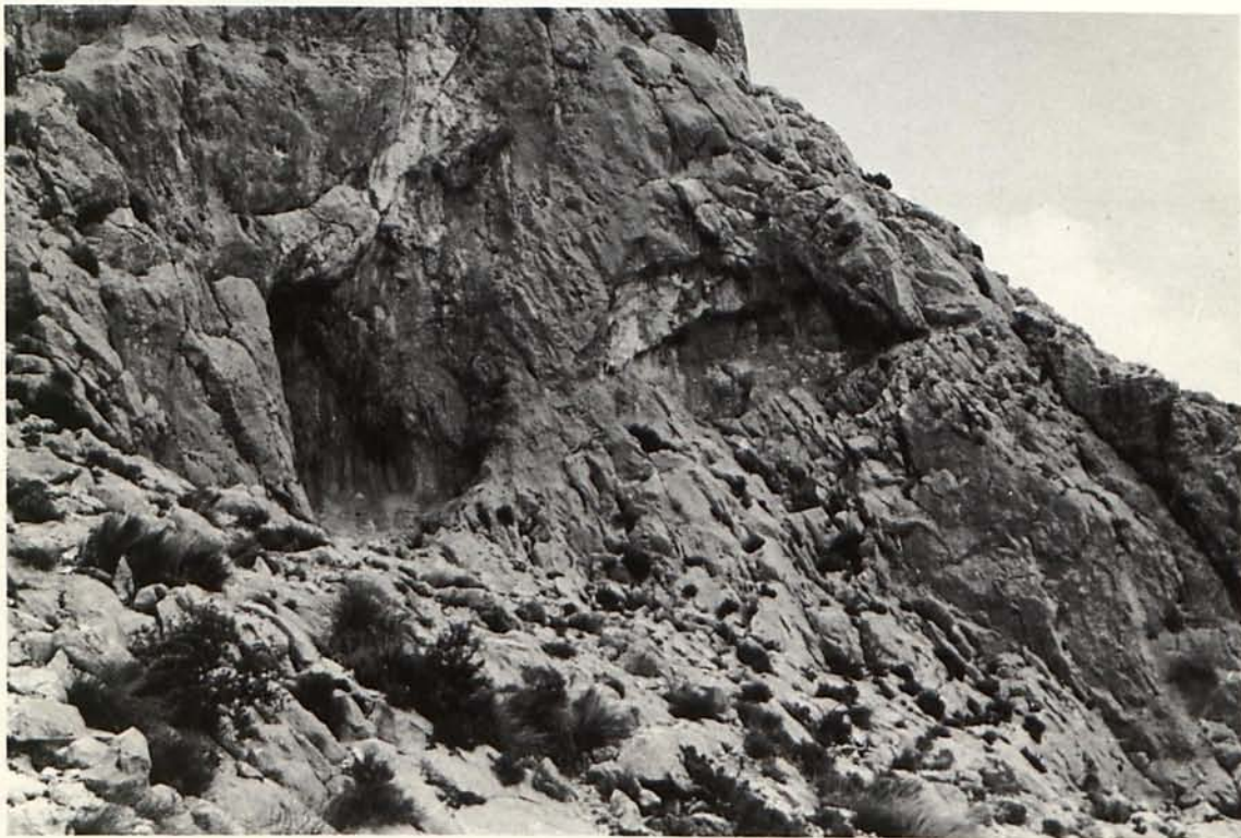
Fig. 3.- Abrigo del Panal visto desde el SO. Las pinturas se encuentran en la oquedad de la izquierda.