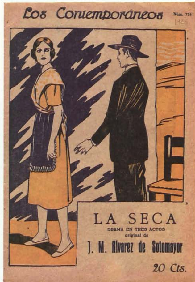
Edición de La Seca de 1923, integrada en la colección Los Contemporáneos.