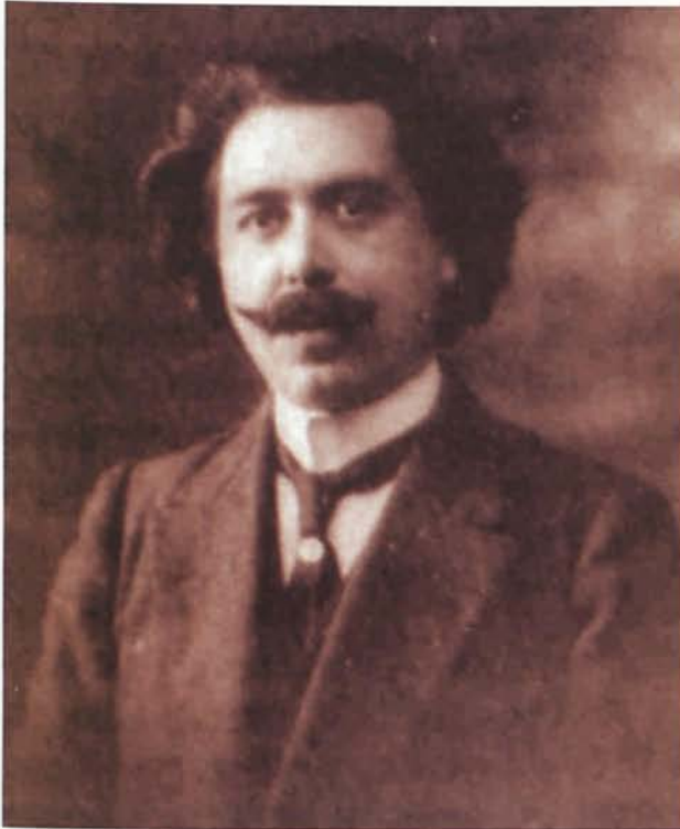
El autor de La Seca , Álvarez de Sotomayor, a los treinta años de edad.

Contemporáneos en sus trabajos Álvarez de Sotomayor. Breve Biografía para escolares (Ayuntamiento de Cuevas de Almanzora y Arraez, Almería, 1997); el artículo «Sotomayor, homenaje al poeta en el cincuentenario de su muerte» (Revista Axarquía , nº 3, Almería, 1998, pp. 161-164); la introducción y notas a la edición de Pan de Sierra (Almería, 1988); notas introductorias a las Obras Completas , editadas en 1997, pese a que, en este caso, nos ofrece mayor riqueza de datos sobre la edición y estreno de La Seca (p. 22): « La Seca (drama rural en un prólogo y tres actos en verso) fue la obra que mayores éxitos y satisfacciones y por la que mas renombre y fama gozó en su carrera, no solo en España sino también en Argentina. A este éxito contribuyó en gran manera el excelente actor Enrique Borrás, que la estrenó en Burgos en 1922 y, después de varias representaciones en Madrid y otros escenarios españoles, la llevó a teatros de Argentina. Fue editada como libro por el propio autor en la Imprenta Levantina de Artes Gráficas, de Cartagena, en 1923...».