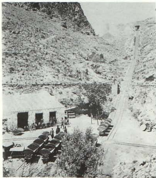
Rampa de deslizamientos de vagonetas de la mina Mulata de Bédar de la Compañía de Águilas. Hacia 1890.

[El Levante, Garrucha 4 de Noviembre de 1888, nº 49].