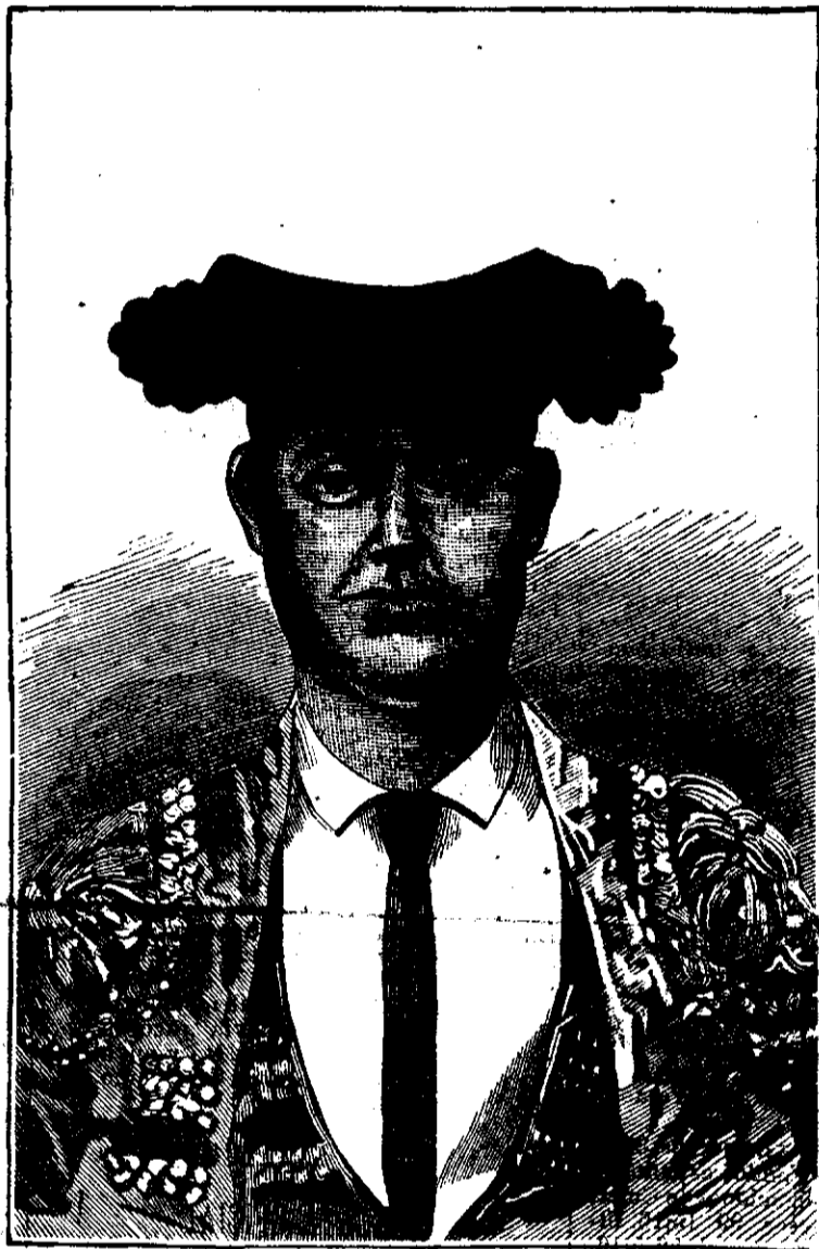
MANUEL GARCÍA (EL ESPARTERO)

»Los ángeles te glorifican; los cielos te reverencian; los arcángeles y