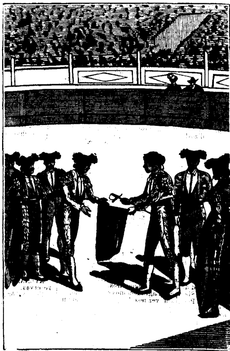
EL GALLO DA LA ALTERNATIVA AL ESPARTERO