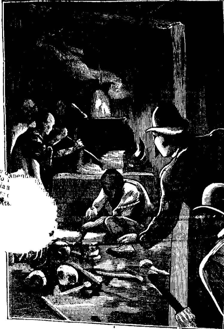
UNA INDUSTRIA REPUGNANTE