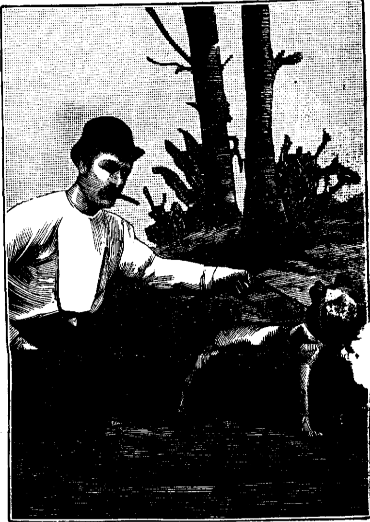
EL CAZADOR DE RATONES

Este establecimiento médico-higiénico, no de cuyos departamentos se representa en el tercer grabado que publicamos hoy, reúne todas las condiciones apetecibles para el objeto que se propone su ilustrado director. El local es amplio, seco, ventilado y bañado por el sol, circunstancias todas indispensables en esta especie de escuelas, si no han de convertirse en ocasión de accidentes harto desagradables y aun funestos, en vez de servir de motivo para el desarrollo físico de la juventud.