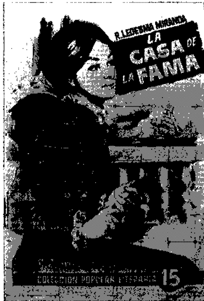
Portada de una edición de "La casa de la Fama"

Los domingos, después de la misa, oída en la capilla de la casa, don Indalecio y su familia marchaban a la Piedad, una de sus fincas de campo. Acompañábales el capellán, que había dicho misa aún más temprano en el convento. Para esas excursiones colectivas, para los viajes o para los baños, mandaba don Indalecio aparejar la góndola con sus dos troncos de mulas. La góndola fue el coche patricio de la pequeña ciudad: era una suntuosa galera de asientos laterales de fina pana, brillante enlucido y amplia berlina; tenía puerta trasera con estribo plegable 61 .