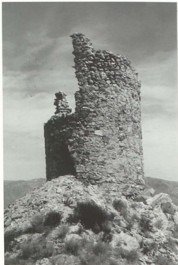
Torre de la Ballebona (Antas).

Se encuentra situada en el límite de los términos municipales de Antas y Huércal-Overa, en la margen izquierda de la Autovía del Mediterráneo, antigua CN-340 a la altura del Km 218. Co-