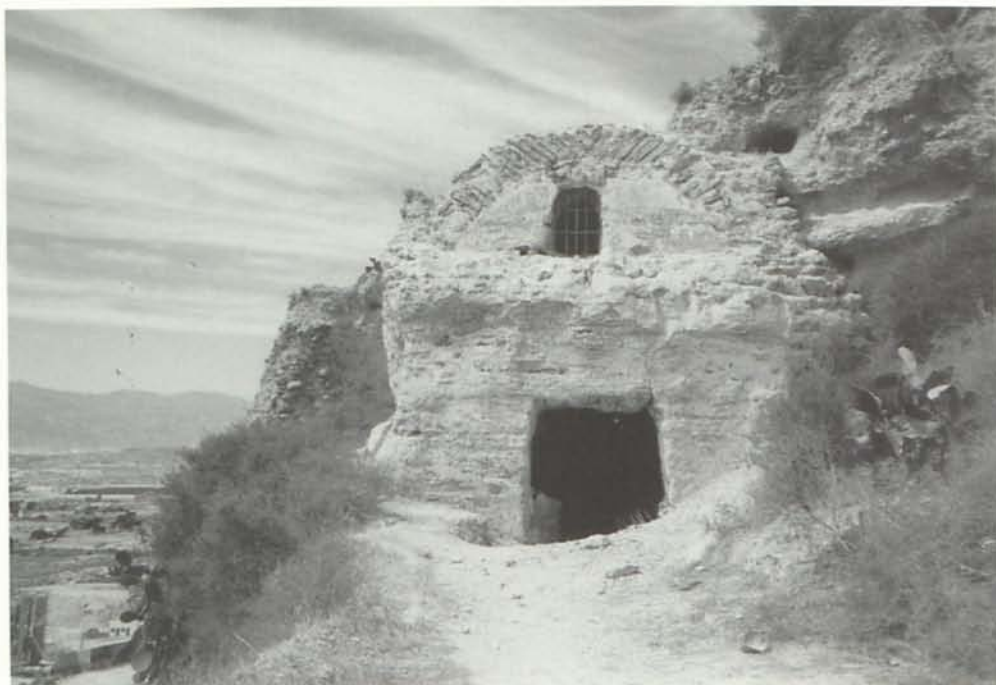
Aljibe del castillo de Vera.

Al O se conservan otros dos aljibes, muy próximos entre sí. El situado más al S y a nivel más elevado, se encuentra completamente enterrado, pudiendo verse de él su muro O, construido de hormigón de cal y canto y el ángulo interior SE con parte de su bóveda de mampostería. El otro, rectangular y de grandes proporciones, no se puede visitar por encontrarse en un cortado, si bien, por un agujero practicado en la parte alta del muro S, se puede ver su interior, con sus muros de hormigón de cal y canto, su enlucido en perfecto estado de conservación y su bóveda de mampostería. Sus dimensiones aproximadas pueden ser de 9,00 x 3,50 metros, siendo su profundidad superior a los 3,00 metros. Se encuentra parcialmente relleno y tiene sobre él una enorme capa de relleno de tierra y grandes piedras.