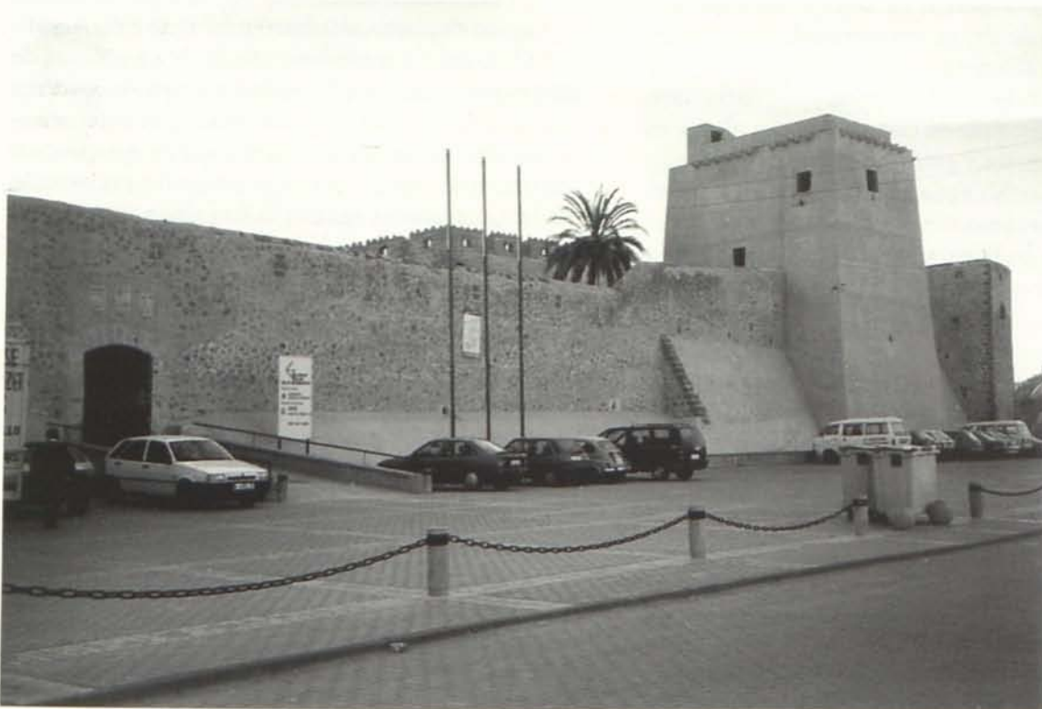
Castillo de Cuevas en 1997.

Las diferentes plantas se cubren con bóvedas de medio punto que apoyan sobre los muros