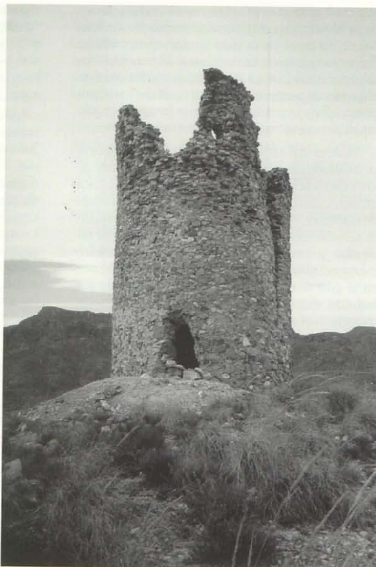
Torre de las Mateas o de Tejefín (Cuevas).

A este castillo le fue incoado expediente de declaración de BIC en 1985.