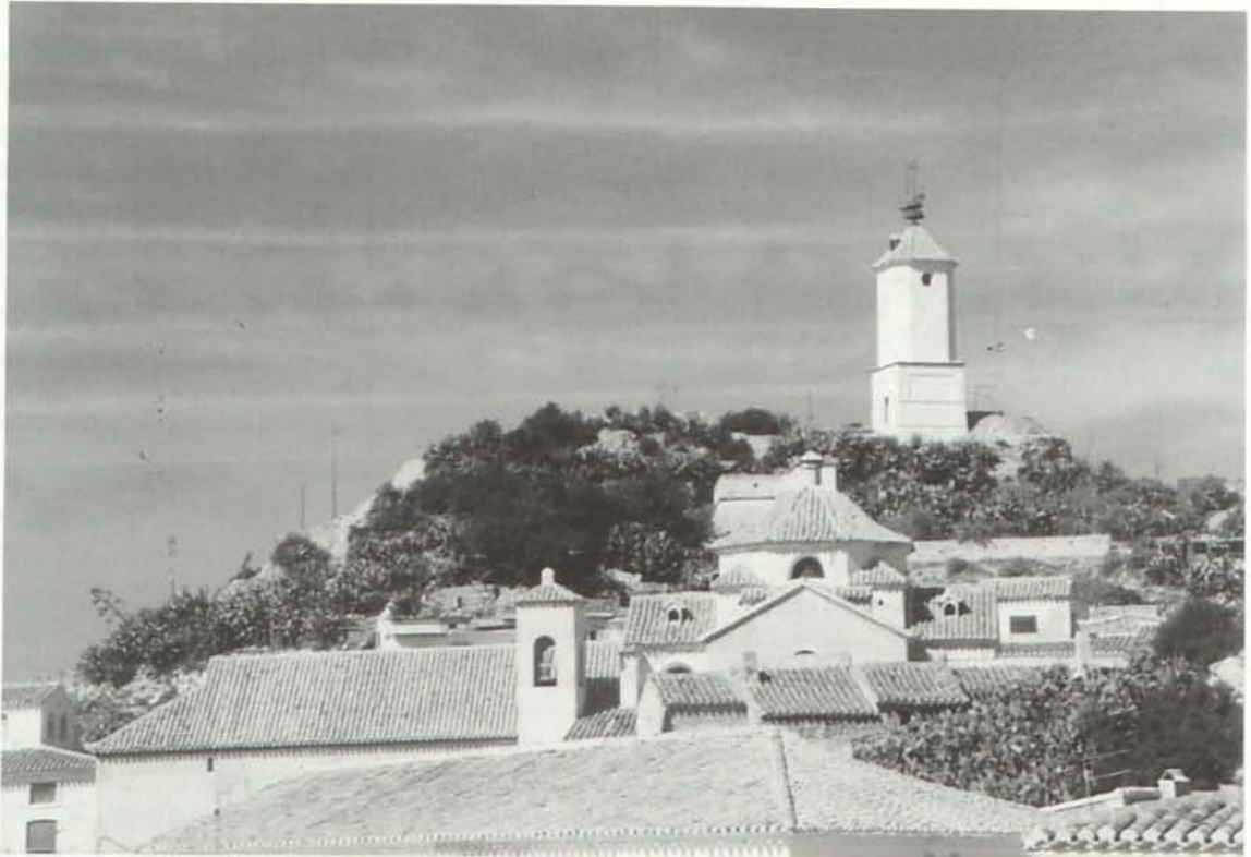
Castillo y torre de Zurgena.

y achaflanados los ángulos. Interiormente tiene adosado al muro descrito otro de ladrillo, también enlucido con mortero de cal, con un espesor de 0,30 metros. Es posible que la bóveda que lo cubría apoyara sobre este último muro y fuese del mismo material.