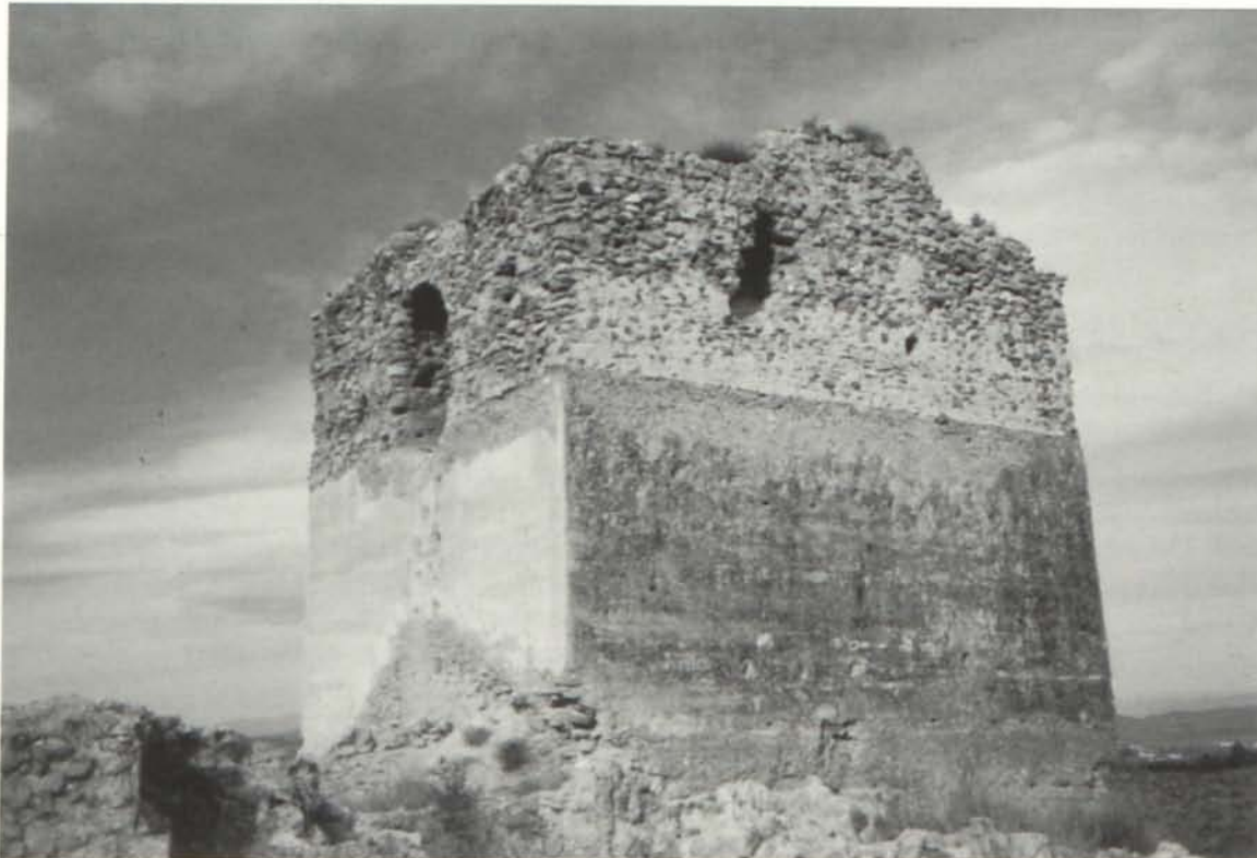
Castillo de Overa o de Santa Bárbara.

Se encuentra declarado BIC desde 1949, aunque sólo aparece la mencionada torre en la relación de la Consejería de Cultura de la Junta de Andalucía.