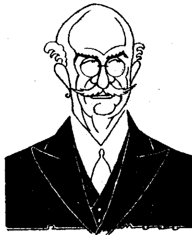
El viejo león republicano, domador de serpientes venenosas