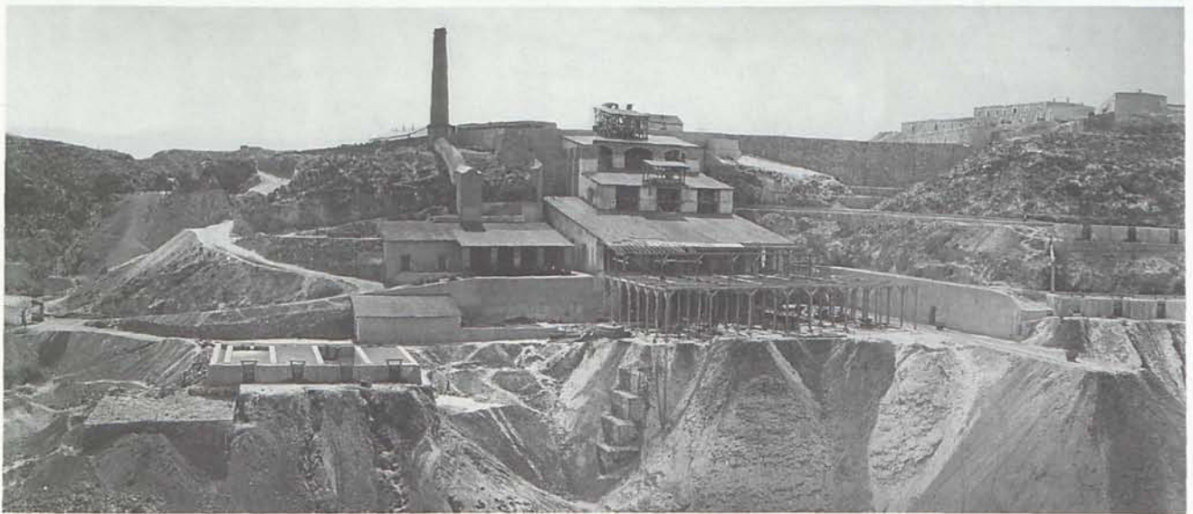
1. Pinar de Bédar. Gran lavadero de minerales hacia 1885.

La explotación a gran escala de las minas de hierro ubicadas en la Sierra de Bédar se prolongó desde 1885 hasta 1970, con un prolongado paréntesis desde el cierre de las minas en los años 20 y su reapertura por parte de la empresa Hierros de Garrucha, S. A. en 1952. La minería en la zona permitió que un pueblo que no llegaba a los 1.000 habitantes incrementara su población hasta un máximo de 6.040 habitantes en 1910, coincidente con el máximo auge de la minería del hierro. Este aumento de población condicionó un aumento de mortalidad en la cual el trabajo en la mina tuvo su papel, pero se desconoce el impacto que tuvieron las condiciones del trabajo directamente sobre la salud de los mineros, algo que no se puede inferir de los registros de defunción, que solo indican accidentes mortales en la mina.