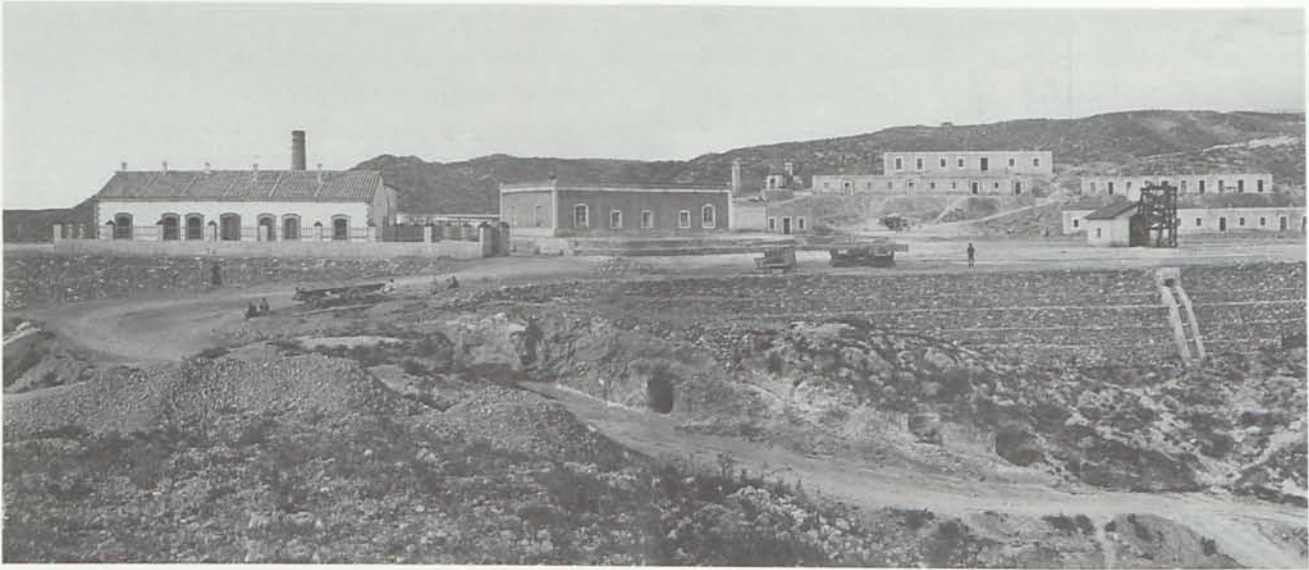
3. Vista general del Pinar de Bédar hacia 1885.

minería metálica, y entre ellas la del hierro, tuvo que esperar hasta 1961 para ser incluida dentro de este seguro, por lo que los mineros de Hierros de Garrucha no disfrutaron del mismo hasta esta fecha.