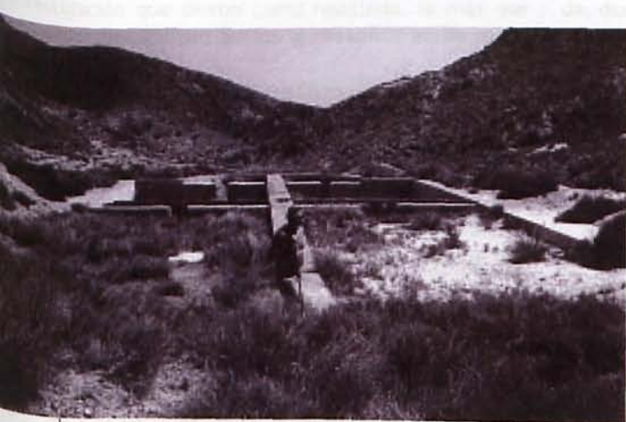
Figura 3. Balsas que formaban parte del proceso de tratamiento en las instalaciones metalúrgicas de las "Minas de Abellán"

Pero la compañía de capital británico, no se encontraba sola en la minería aurífera de la Sierra del Cabo de Gata, ya que el gobierno de la II República Española, mediante el Instituto Geológico y Minero de España, estaba realizando investigaciones mineras y metalúrgicas.