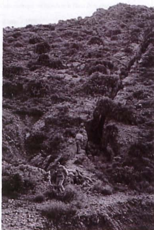
Figura 4. Filón aurífero explotado en una de las concesiones mineras de la compañía Minas de Rodalquilar S.A.

El origen de los yacimientos minerales que contiene esta sierra, está relacionado con la actividad del vulcanismo calcoalcalino Neógeno del Sudeste de España, fundamentalmente con la creación de calderas, el relle-