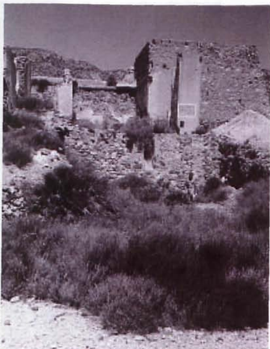
Figura 2. Ruinas de la zona de molienda en las instalaciones metalúrgicas de las "Minas de Abellán"

cánicos de la Sierra del Cabo de Gata (Almería), descubierto en el año 1883 en la mina "Las Niñas", junto al pueblo de Rodalquilar (Hernández Ortiz, 2002).