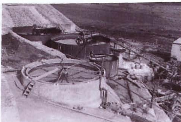
Figura 6. Zona del tratamiento por vía húmeda en la Planta Dorr, propiedad de Minas de Rodalquilar S.A.