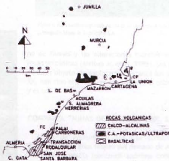
Figura 1. Contexto geológico esquemático de las minas de oro de Rodalquilar

El éxito de la compañía británica supuso el final de una serie de fracasos que habían puesto en entredicho la viabilidad de la explotación del oro de los filones vol-