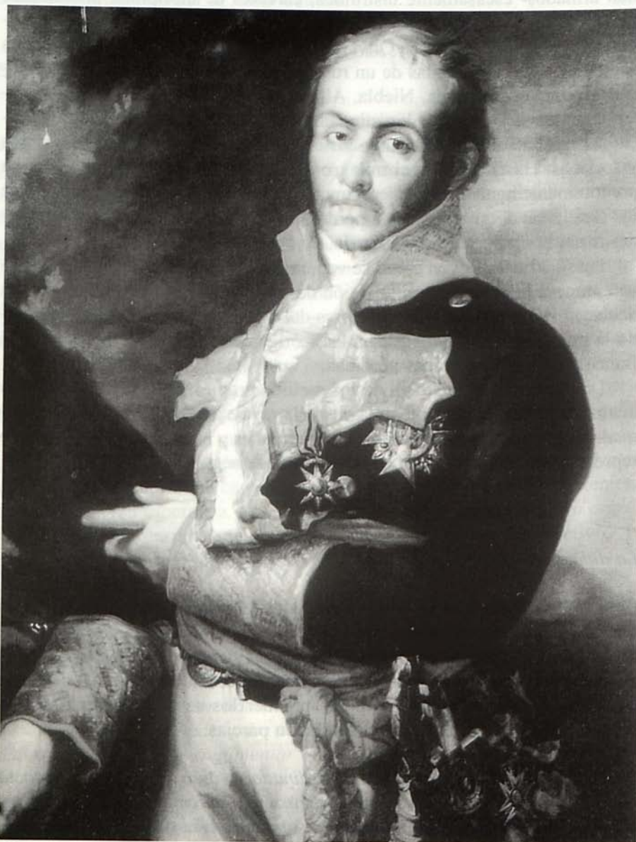
El Marqués de la Romana