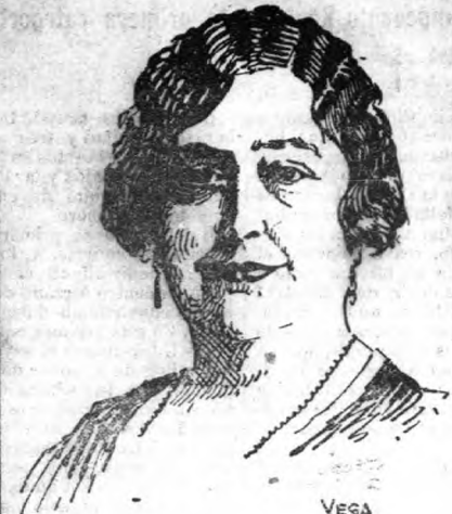
Nuestra ilustre paisana, la excelsa escritora republicana, doña Carmen de Burgos «Colombina», cuya memoria ha sido ultrajada por el cerril Ayuntamiento monarquizante del bello pueblo de Tahal

«Euforia» a todo paato y por todas partes.