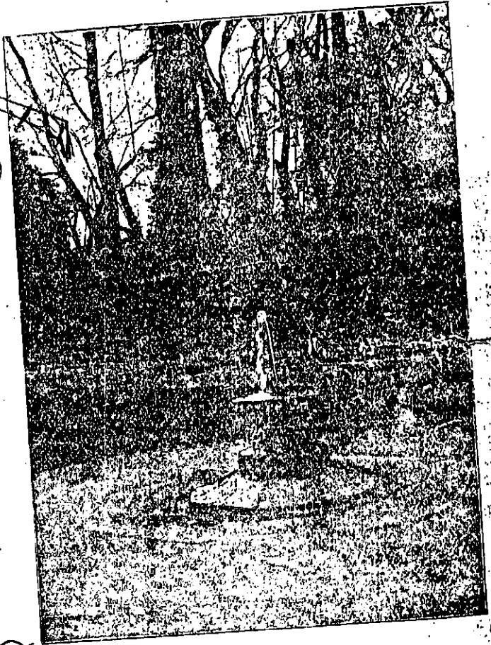
Las fuentes de Granada... ¿Habéis sentido, en la noche de estrellas perfumada, algo más doloroso que su triste gemido? VILLAESPEA: De «El Alcázar de las Perlas».