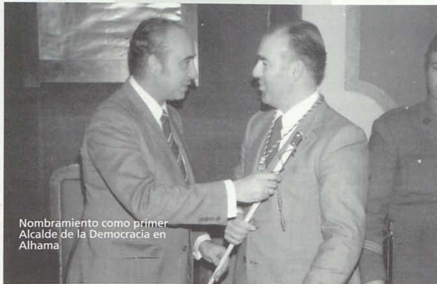
Nombramiento como primer Alcalde de la Democracia en Alhama

Afable y emprendedor ha apoyado siempre proyectos culturales y deportivos