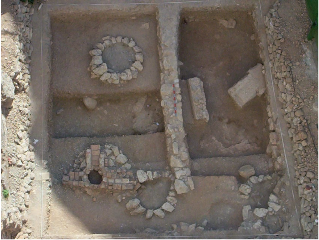
Lámina I. Vista general