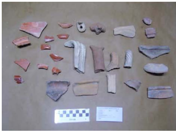
Corte 13, U.E. 1, N° 13004.