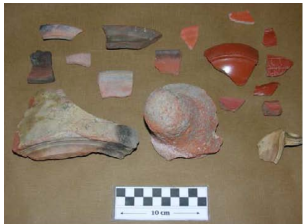
Cerámica de seguimiento