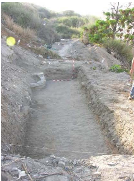
Vista general del sondeo 13.

Al comienzo de la excavación del corte encontramos una tierra de color marrón claro (U.E.1) con abundantes escombros y basuras que se mezclan con material cerámico protohistórico y de época romana. Esta unidad estratigráfica coincide con la U.E. 1 del sondeo 12 compartiendo iguales características.