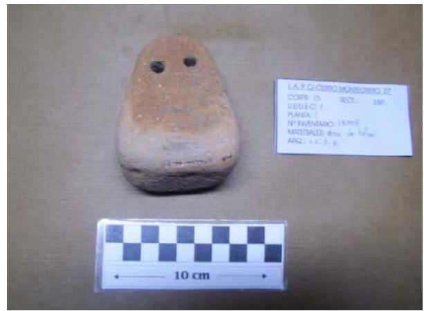
U.E 1, corte 13 Pesa de telar. N°13006.