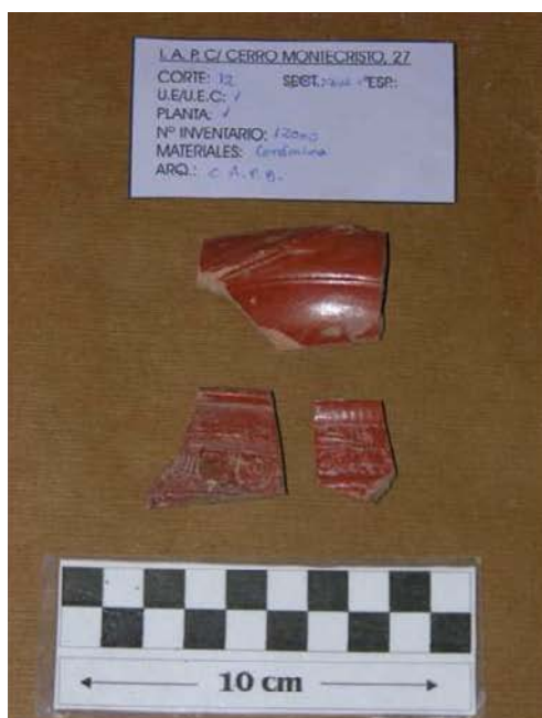
Corte 12, U.E. 1, N° 12000

De esta misma unidad sedimentaria son los fragmentos de hierro encontrados, uno de ellos es una especie de argolla y el otro es un rectángulo macizo de tamaño considerable y vértices achatados.