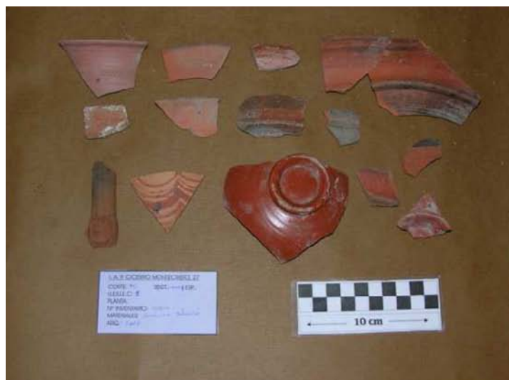
Corte 12, U.E. 1, N° 12004