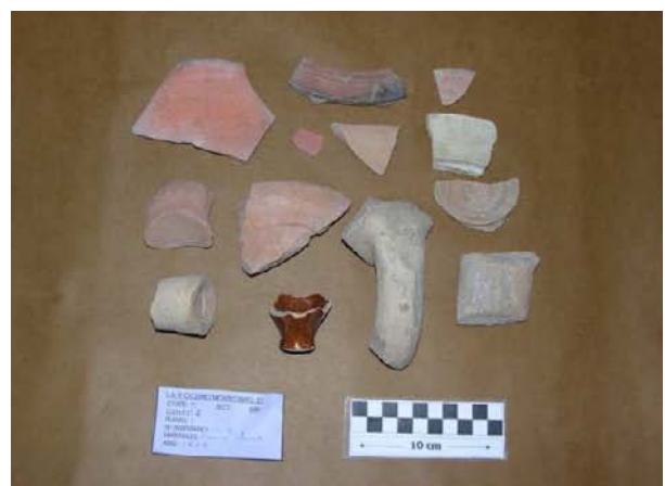
Corte 13, U.E. 2, N° 13017.