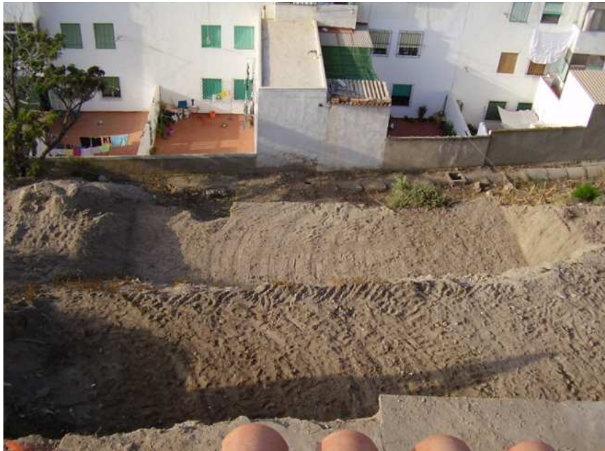
Vista general tras el seguimiento mecánico.