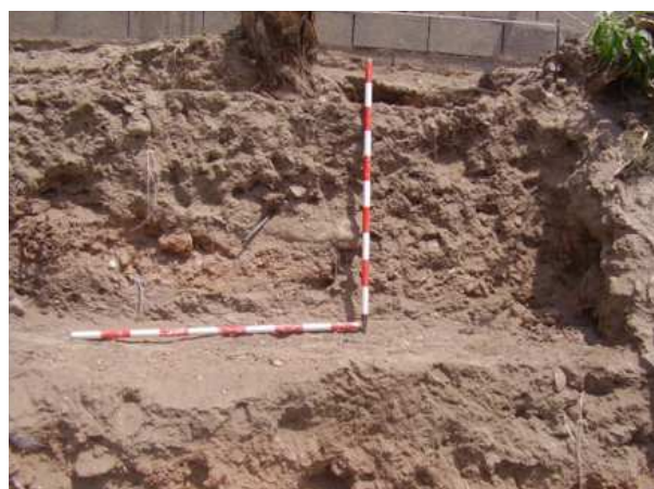
Vista general del sondeo 12.