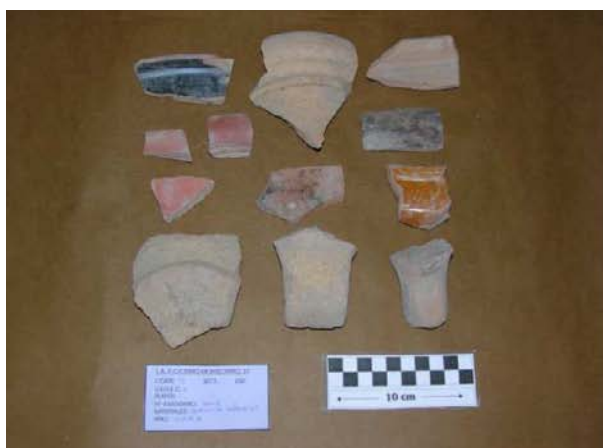
Corte 13, U.E. 2, N° 13012