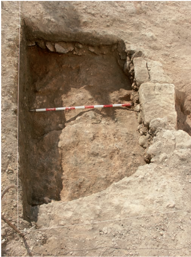
Lámina II. Fosa islámica.

Esta situación podemos relacionarla con la alteración sufrida con la construcción de la vivienda del siglo XIX, que llega hasta la base geológica, quedando niveles residuales como el documentado en lo que parece ser el cauce de un pequeño arroyo (UE 12).