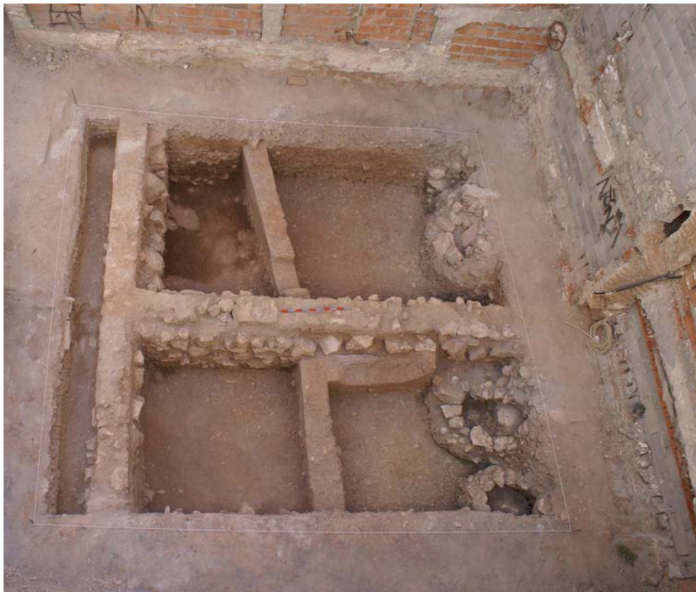
Lam. I. Planta General.