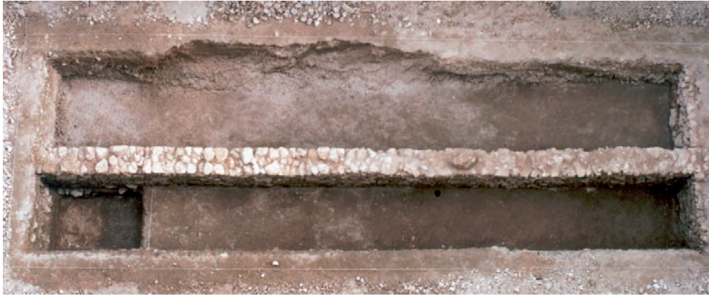
Lámina I. Vista final de la excavación