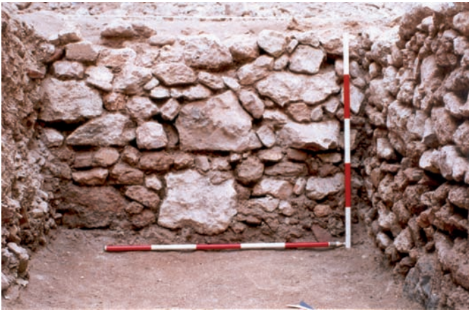
Lámina II. Muro de cimentación MR201