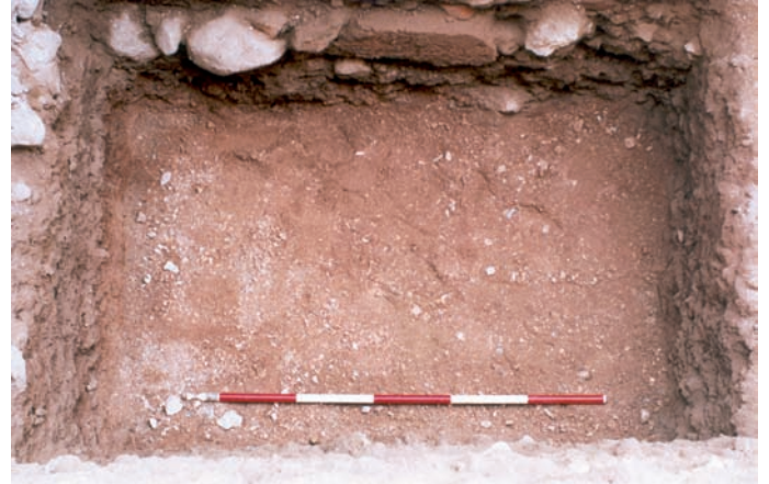
Lámina III. Unidad estratigráfica UE1010