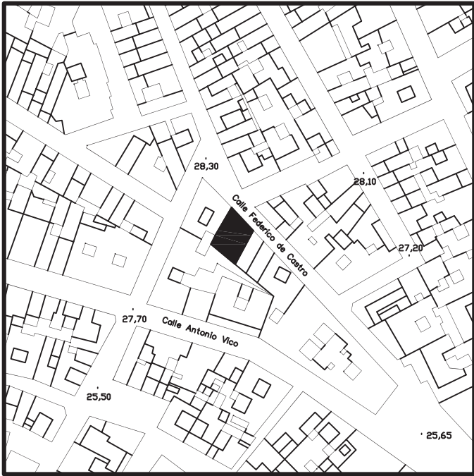
Figura 1. Situación del solar