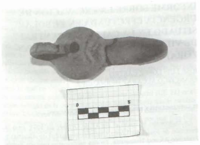
LÁM. V: Cándil de piqueta.