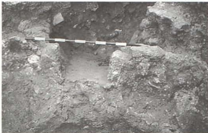
LÁM. III: Entrada de las piezas al horno.