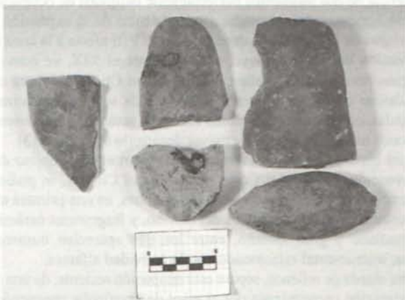
LÁM. I: Lengüetas y pesa de telar recuperadas en la intervención del corte 2.

Respecto al tipo candil, se rescató un candil de piquera con decoración de líneas en manganeso a lo largo de la piquera y en el cuer-