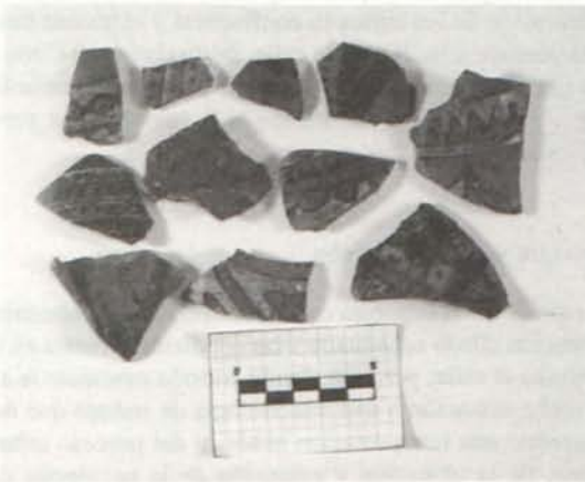
LÁM. IV: Algunos fragmentos de jarras decoradas con cuerda seca