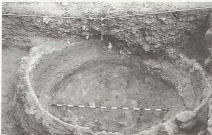
LÁM. II: Vista del horno, en todo su diámetro.