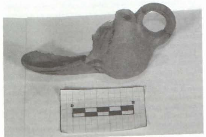
LÁM. VI: Cándil de piqueta.