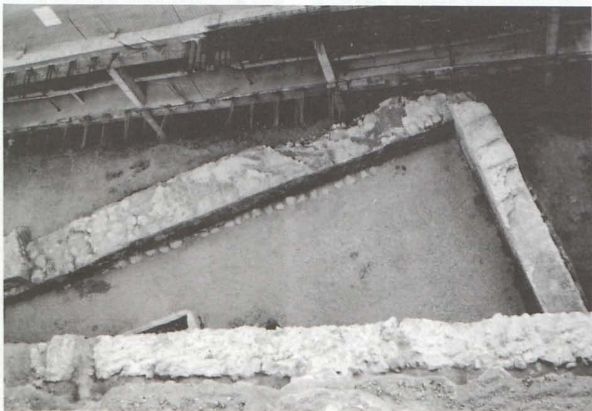
LAM. VII. Estructuras hidráulicas en el cauce de la Rambla de Belén.