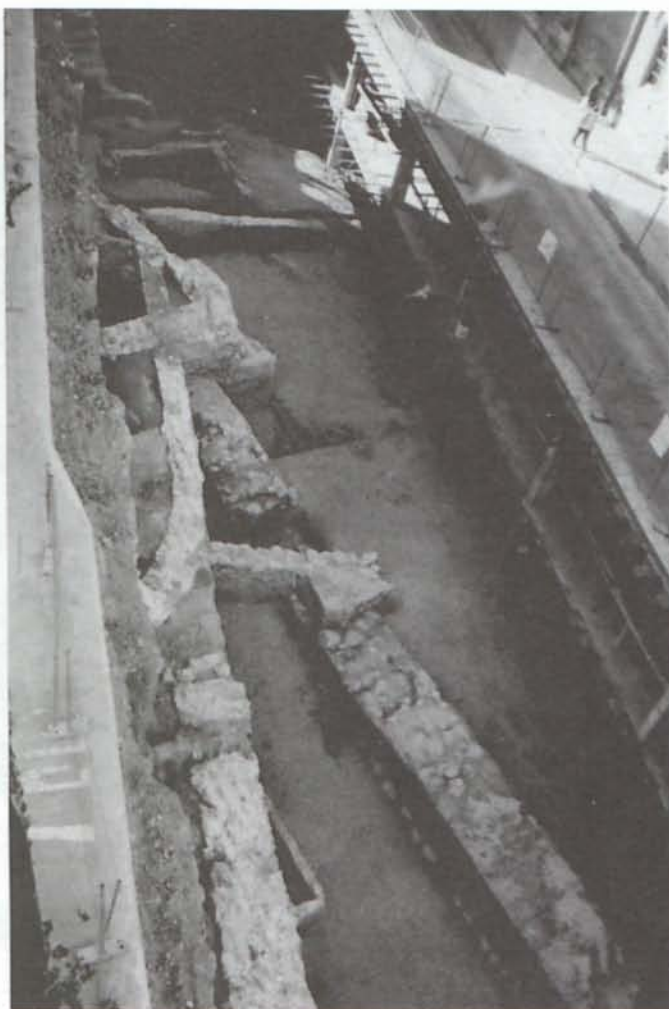
LAM. VI. Estructuras hidráulicas en el cauce de la Rambla de Belén.