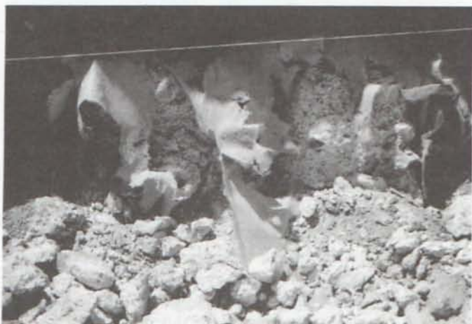
LAM. II. Estructura de fortificación seccionada.