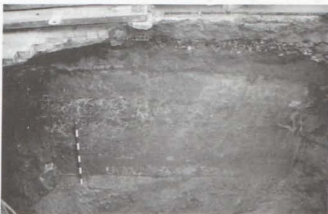
LAM. III. Encauzamiento de la Rambla de Belén (o del Obispo).

nuevo cauce algo más al este, actual Avenida Federico García Lorca, permitió la urbanización del antiguo cauce dando lugar a la calle Javier Sanz. En esta misma zanja, en la intersección de Javier Sanz con la Rambla Obispo Orberá, localizamos un muro de mortero de cal y arena de gran envergadura que solo pudimos fotografiar ya que existía peligro de desplome de los laterales de la zanja y tuvo que ser rápidamente cerrada. Probablemente esta construcción este vinculada a las estructuras de encauzamiento de la Rambla del Obispo.