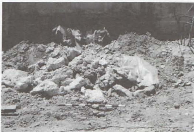
LAM. I. Estructura de fortificación seccionada.