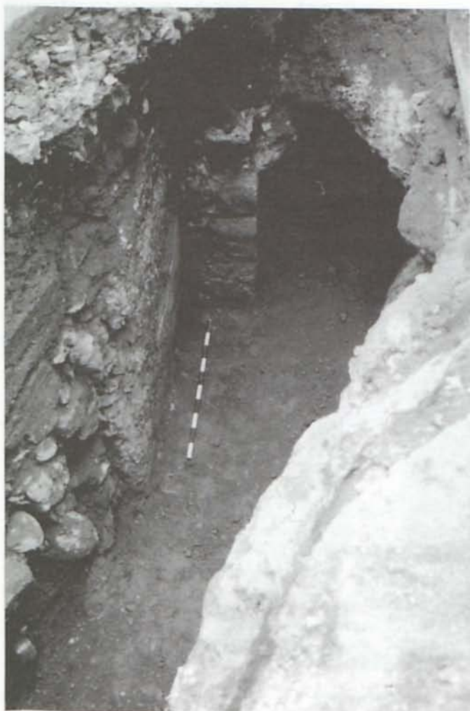
LAM. V. Fortificación de la ciudad.