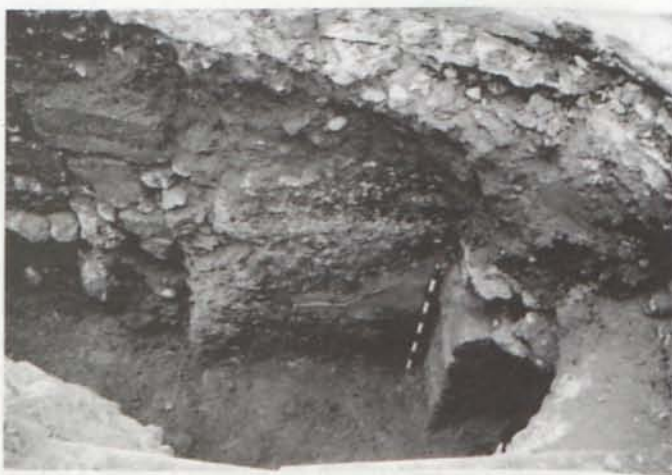
LAM. IV. Fortificación de la ciudad.

De acuerdo con el proyecto de intervención arqueológica presentado por ARQUEOLOGÍA TÉCNICA Y URBANA, la zona pendiente de excavación en la Rambla Obispo Orberá se denominó Área C, ocupando inicialmente una superficie de 406 m 2 (rectángulo de 58 metros por 7 metros coincidiendo sus lados mayores con el eje longitudinal de la calle). La excavación se desarrolló entre los días 18 de marzo y 10 de abril finalizando la documentación gráfica, planimetría y dossier fotográfico de cada una de las estructuras descubiertas, el día 15 de abril. Toda la documentación que obtuvimos en la intervención la entregamos a ARQUEOLOGÍA TÉCNICA Y URBANA, empresa responsable de la actividad arqueológica, por lo que no consideramos oportuno realizar una descripción detallada de cada una de las estructuras y de las relaciones espaciales, estratigráficas o cronológicas existentes entre ellas sin un soporte gráfico (planimetría). Debemos recordar que la excavación se ha realizado en el cauce de una antigua rambla por lo que es difícil asociar el material mueble recuperado con las estructuras excavadas ya que, el sedimento arqueológico está constituido por las sucesivas avenidas de la rambla. Las estructuras localizadas las dividimos en dos grupos en función de su cronología. Las más superficiales