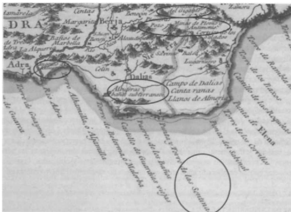
Figura 3. Detalle del mapa del Reino de Granada de 1795 de Tomás López.

Un recorrido por algunos detalles del mapa de Tomás López es mucho más que un paseo por la geografía almerñense a finales del siglo XVIII. En las páginas siguientes realizaremos un fugaz itinerario por algunas parcelas de ese territorio.