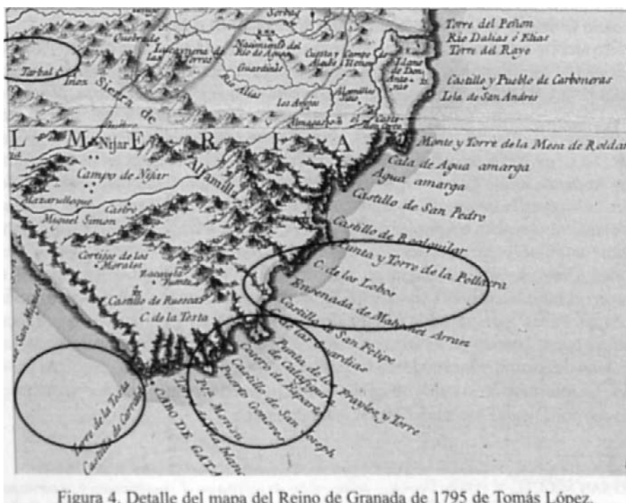
Figura 4. Detalle del mapa del Reino de Granada de 1795 de Tomás López.

" ANDUJAR CASTILLO, F. «Una estructura de poder. El monopolio de la producción y comercialización del azúcar en Adra (siglo* XVI-XVII). en BARRIOS AGUILERA, M. - ANDUJAR CASTILLO, F. (Eds.) (1995): Hombre y territorio en el Reino de Granada (1570-1610). Estudio sobre repoblación . Almería. Edit. Instituto de Estudios Almerienses* 351-382.