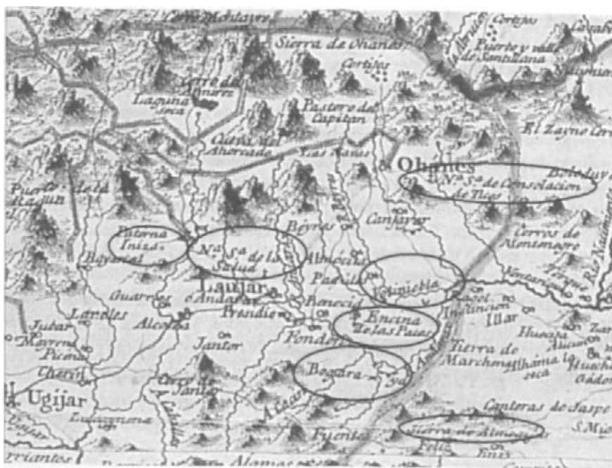
Figura 5. Detalle del mapa del Reino de Granada de 1795 de Tomás López.