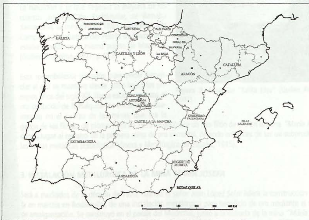
Mapa 1. Localización de Rodalquilar.

Pero durante los siglos XV al XVIII no parece haber evidencias conocidas de explotaciones auríferas en la zona de Rodalquilar.