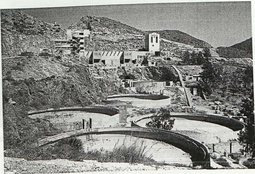
Figura 7. Instalación metalúrgica de la "Empresa Nacional Adaro" (1956).