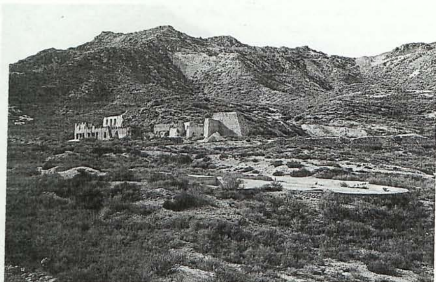
Figura 5. Instalación metalúrgica de "minas de Abellán" (1929).

En esta ocasión el fracaso fue probablemente debido a la baja ley de los minerales tratados y/o a la falta de la necesaria pericia técnica en la metalurgia del oro.