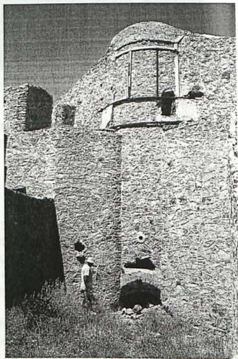
Figura 4. Horno de cuba. Mina "María Josefa" (1925).

Tras el fracaso de D. Juan López Soler, pronto aparecieron nuevos proyectos minero-metalúrgicos en Rodalquilar (Estadística Minera y Metalúrgica de España, 1929 y 1930). Uno de ellos será el de D. Antonio Abellán, quien en el año 1929 implica su fortuna personal en la construcción de una planta metalúrgica para el beneficio de oro. La edificación