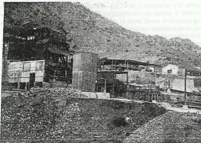
Figura 6. Instalación metalúrgica de "Minas de Rodalquilar S.A." (1930). (Rubio de la Torre. 1935).