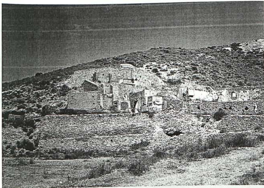
Figura 3. Instalación metalúrgica de amalgamación. Mina "María Josefa" (1925).

En un principio, era de esperar que todo saliera bien, dado que existía oro en estado libre que como tal era susceptible de formar una aleación con el mercurio (amalgama) que posteriormente y mediante hornos adecuados sería separada en sus dos componentes principales: oro y mercurio. Pero en el proceso del caldeo de los minerales auríferos en el horno de cuba, se originaban sustancias que impedían el correcto funcionamiento del proceso de amalgamación. Esto supuso el fracaso de toda la operación en el año 1926 (Estadística Minera y Metalúrgica de España, 1926).