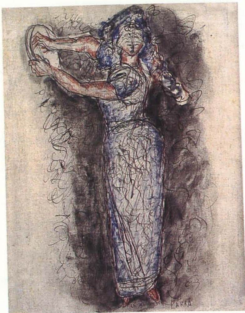
Jeune femme au tambourin. Pluma y óleo sobre tela. 50 X 39'5 cms.