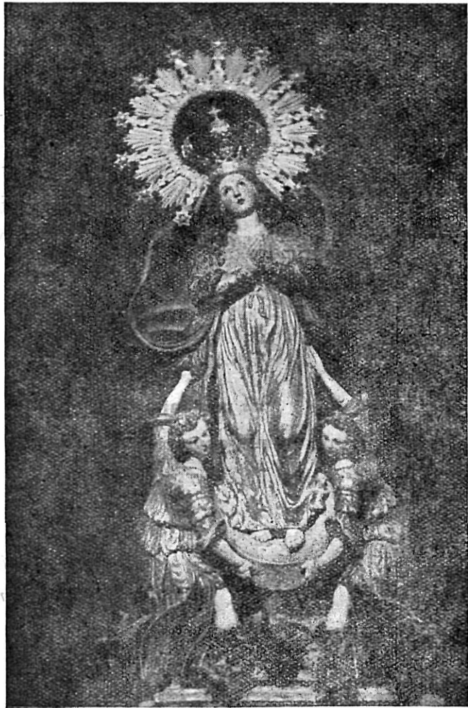
NUESTRA SRA. DE LOS DESAMPARADOS O DEL SALIENTE ALBOX