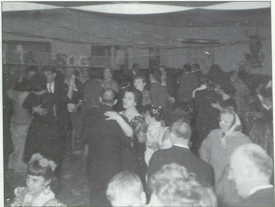
ASAMBLA DEL GRUPO SALMERÓN 123-5th Ave., Brooklyn, N.Y. Noviembre 15 de 1939

La existencia del Grupo Salmerón se mantuvo mientras el grupo humano que formaban las familias españolas estuvo presente. Después, el paso del tiempo, los mayores que iban muriendo, los jóvenes casán-