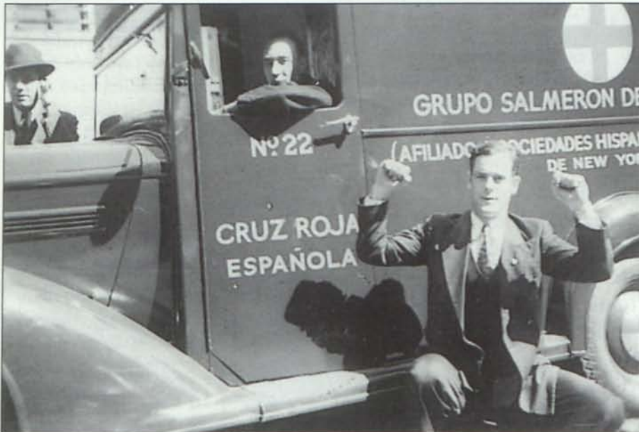
Al heroico pueblo español para los hijos de Alhama

pediste en tu carta. Lo haré lo mejor que pueda.