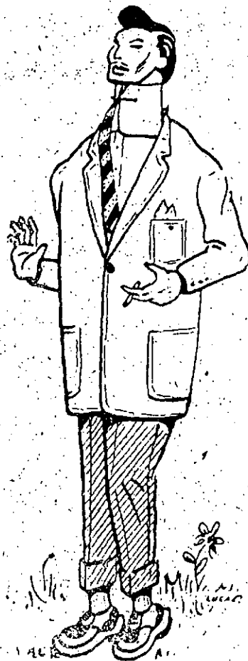
Un chico «elegante»

Todo el que desee saber lo que revela su grafismo, al aficionado grafólogo Doctor A. puede mandar a esta Redacción (Plaza de Careaga, 3) unas veinte líneas escritas a pluma en un papel sin rayar.